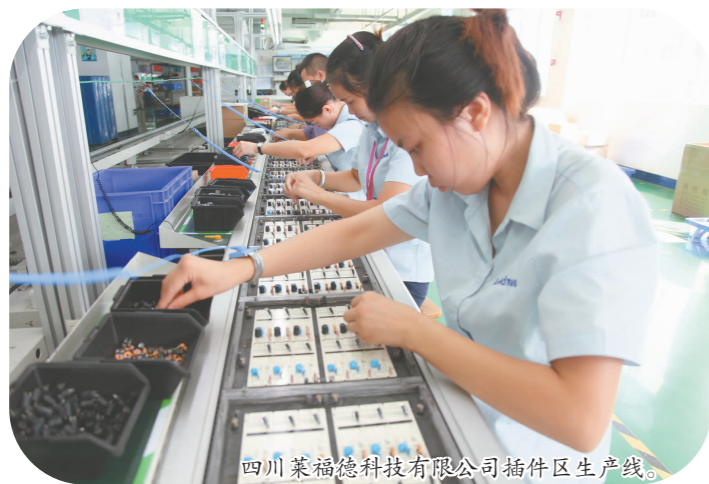
四川莱福德科技有限公司插件区生产线。

方面改进技术、引进企业,拉长产业链和产品链,提高产品附加值。三是围绕主导产业、龙头企业开展产业链招商、精准招商,加快产业配套,以起到示范作用。 搭建平台,为园区企业发展提供完善的环境和条件。计划建立产学研基地,更好地服务成长型企业。研究解决企业营运成本较高的问题,减轻企业负担,增强企业竞争力,提供平台,解决企业招工难问题。建立覆盖企业、人才等多个方面的创新创业激励扶持政策体系,激发企业创新的积极性。加大对高端人才的引进力度,为园区建设建言献策,提高园区和企业活力,加大对有贡献人员的提拔和使用力度,盘活园区队伍。