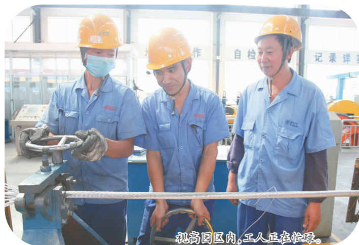
视高园区内,工人正在忙碌。

子然置地、和邦集团、川航海峡飞行学院、柴桑河、泉龙河生态湿地等项目生产要素保障和项目范围内杆管线迁改问题。大力扶持企业,设立企业应急转贷资金和产业发展专项资金,为11户企业协调融资1.41亿元,重点支持战略新兴产业,扶持中小企业成长,做大做强工业经济。 抓实科技促创新。建成市级以上技术研发和服务平台20余家;设立产学研用合作技术创新组织4家,高新技术企业累计达13户。加大科技投入,建立创新创业孵化中心,积极创建省级高新技术产业园区。