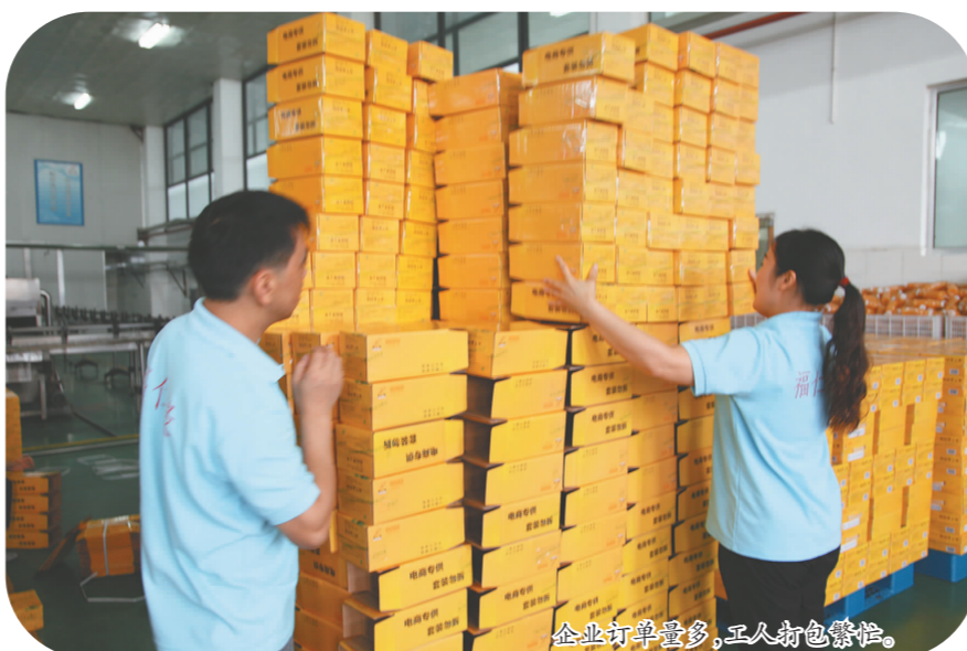
企业订单量多,工人角色繁忙。