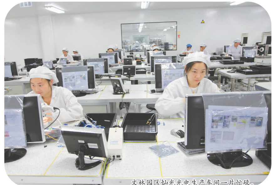
文林园区灿光光电生产车间一片忙碌。