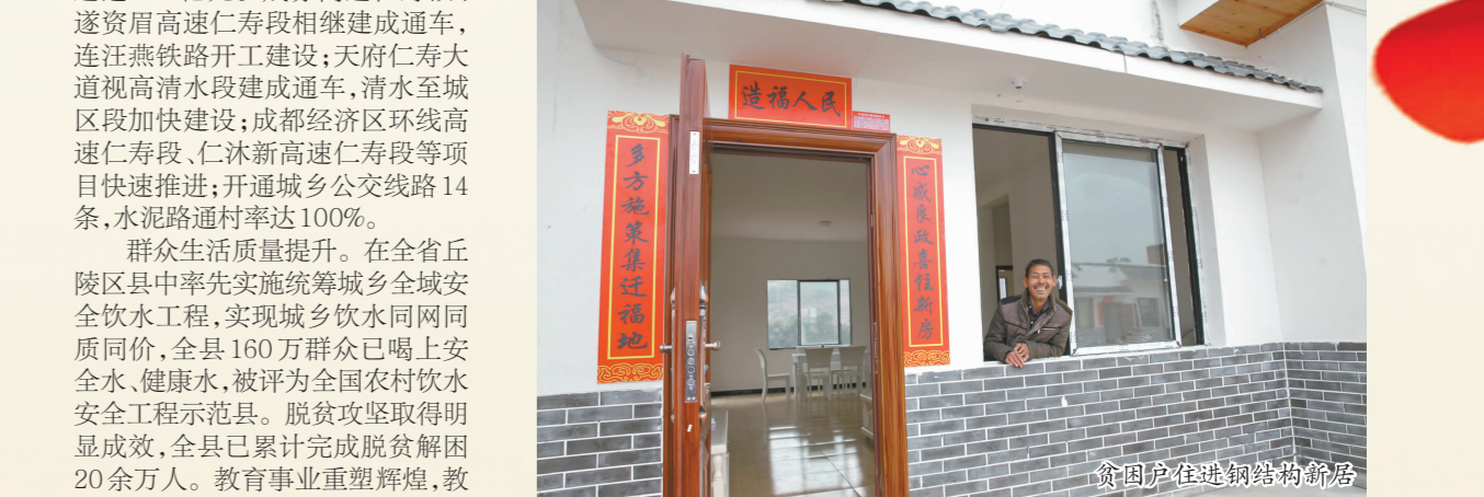
贫困户在镇村便民服务站

化服务体系全面建立。首创初初投初访主要领导负责制、群众来信来访当天办理、“三三”调解代理等群众工作制度，推行“五大五小”工作法，实现大县小信访目标。坚持人民至上，筑牢执政根基，创新建立夯实基层基础十三条制度，持之以恒厚植良好的经济社会发展土壤，狠抓安全生产，有效防治地质灾害，群众对治安满意度达98%以上，全县大局和谐稳定。