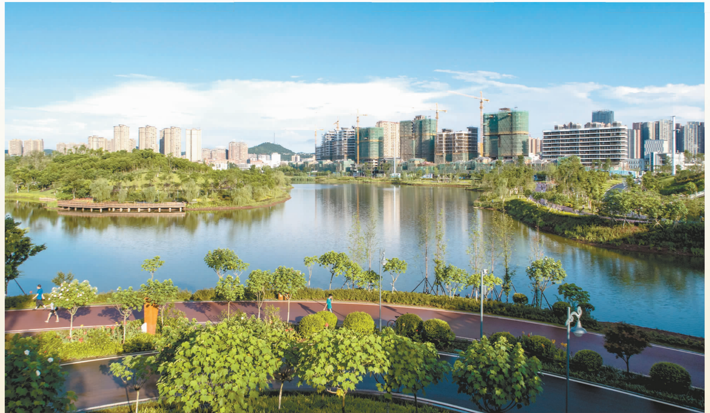
城市湿地公园一角