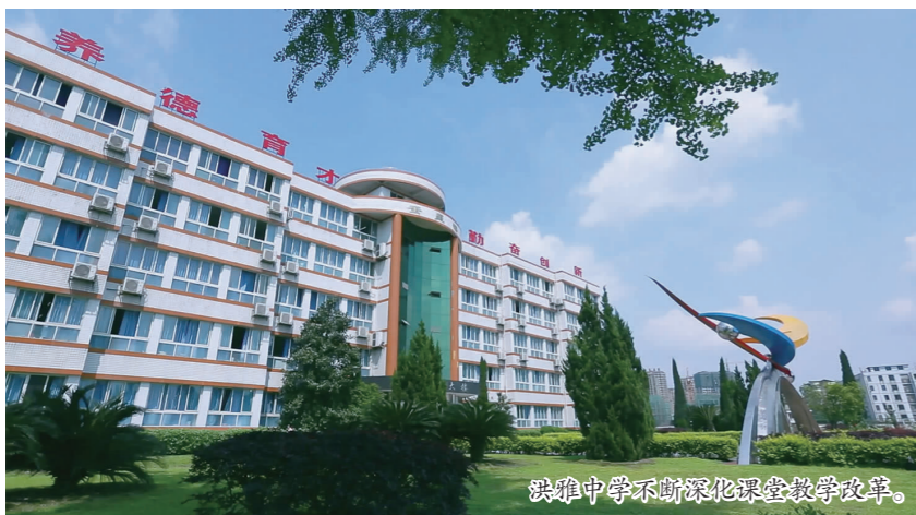
洪雅中学不断深化课堂教学改革。

砥砺前行二十年，如今的洪雅中学，绿化面积一万多平方米，种类繁多的花草树木，有参天的百年银杏，挺直的常青翠松柏，葱郁密集的黄桷树，有塔柏、雪松、刺桐、石榴、铁树等，千姿百态，却又错落有致；学校还确保了四季有花开，有绚丽多彩的杜鹃长廊，葱茏的桂花树、海棠树和樱花树，三角梅、月季、玫瑰、玉兰、紫薇等，五光十色，争奇斗艳；校园环境幽美，人文气息浓厚，这里有含深厚文化底蕴的雕塑作品，有古今中外名人石刻雕像、中国古代四大发明和先秦七子石刻浮雕，有倒立金字塔、探索、搏、解码、放眼世界等大型雕塑作品。奎星楼、致远楼、雅雨楼、文昌宫、桃园、李园、桂园，从一座座楼房的命名，就让人真切地感受到这里的校园文化与文明的气息在这里涌动。学校先后被授予四川省绿化示范校、眉山市绿色学校等荣誉称号。