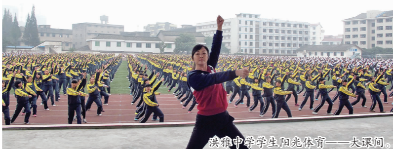
洪雅中学学生阳光体育——大课间。

学校先后获中国教育技术协会中学教育信息化专业委员会理事学校、四川省现代信息技术示范学校、四川省信息技术与学科教育教学深度融合研究及实践活动先进学校等殊荣。