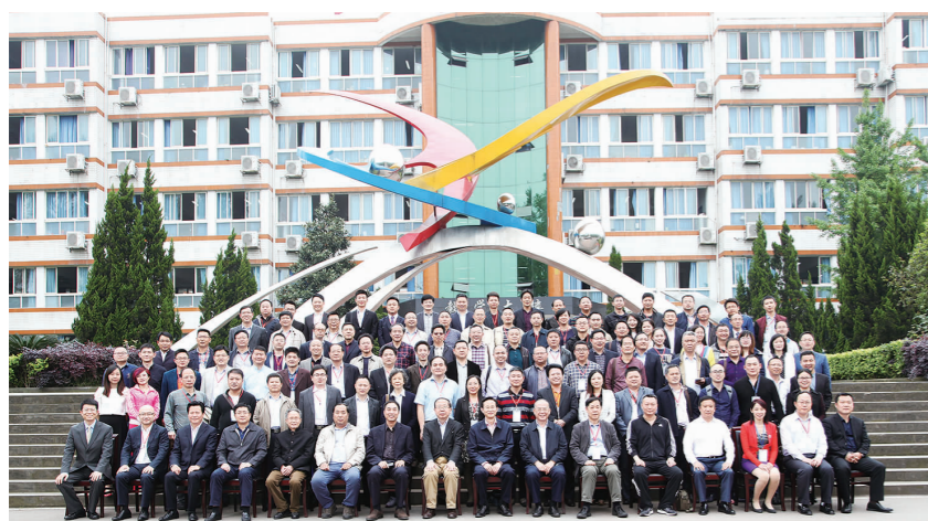
2016年4月25日，全国云教学系统支撑下的教育改革高峰论坛在洪雅中学隆重召开，图为与会领导专家合影留念。