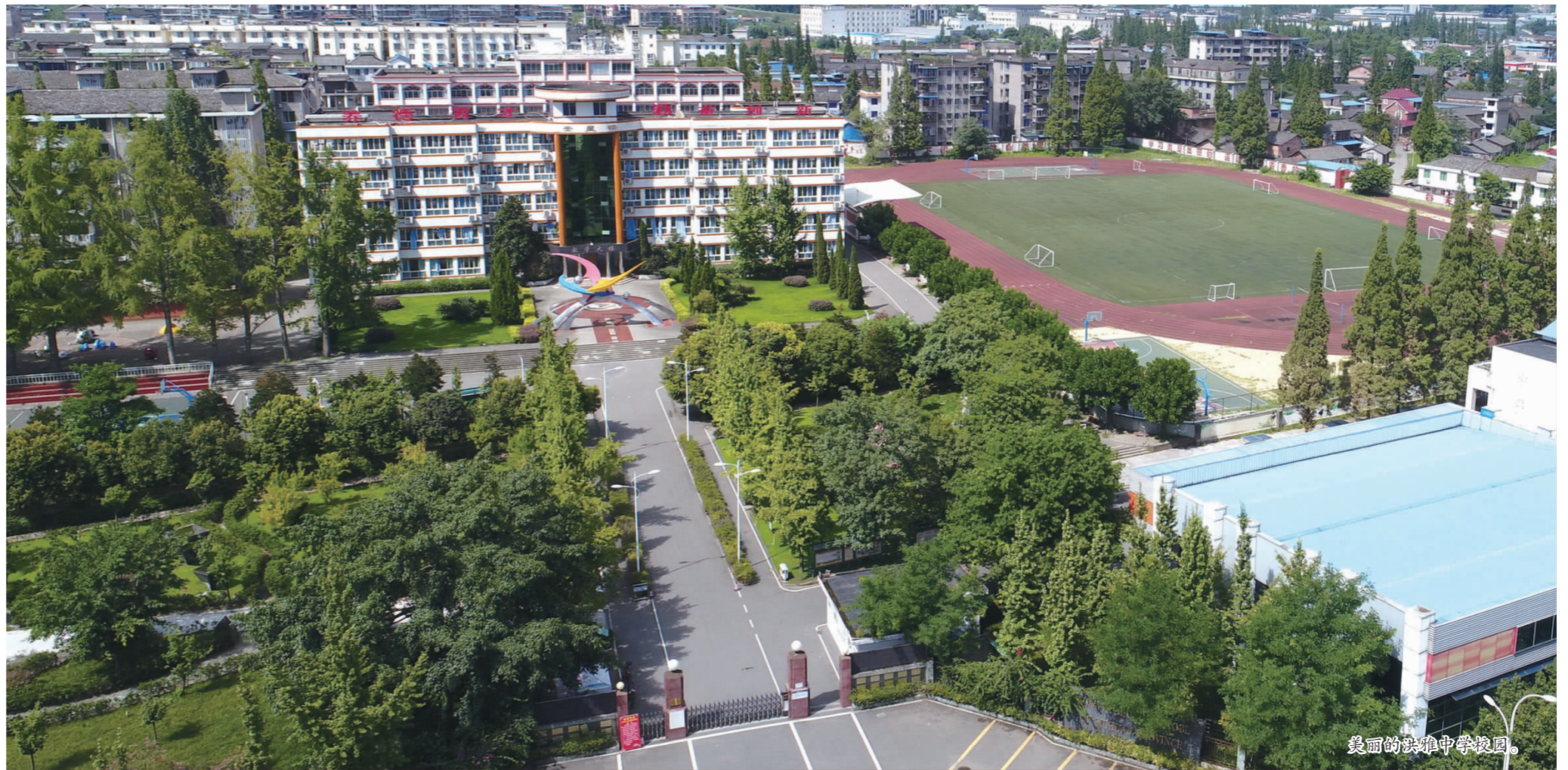
美丽的洪雅中学校园。

伴随着眉山建区设市的步伐，洪雅县委政府高度重视洪雅中学的建设和发展，在上级教育主管部门的直接领导下，洪雅中学紧紧抓住难得的历史机遇，以两个千万工程起步，大力改善办学条件；秉承“生态育人、德能兼备”的办学理念，积极开展课程教学改革，办学水平不断提高。20年间，洪雅中学发生着翻天覆地的变化——