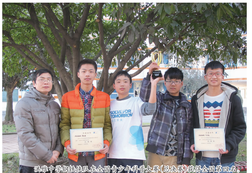
洪雅中学代表队在全国青少年科普大赛(总决赛)获得全国第四名。