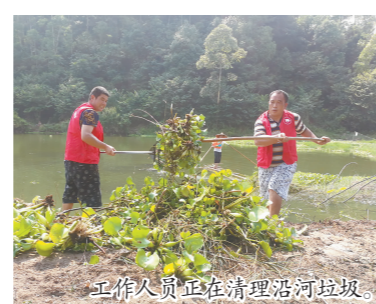
工作人员正在清理沿河垃圾。

集中整治坚持“政府主导、政企联动、全民参与、综合治理”原则,上下一心投入环境问题整治。7月26日起,进入集中整治阶段,在全县主要交通道路、在建工地、村(居)民聚居点等悬挂张贴、发放宣传资料