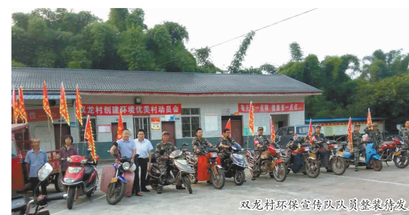
双龙村环保宣传队队员整装待发。

一个目标,即以国家级生态乡镇为标尺,努力实现河畅、水清、岸绿、景美。三项重点,即坚持每日巡河制度和清河制度,纵深推进河长制工作;开展拉网式摸排和点对点整治,持续推进畜禽污染治理工作;广泛宣传动员,干群积极参与,全面推进城乡环境综合治理工作。五支队伍,即成立村级清河队、环保宣传队、抽粪队、监督