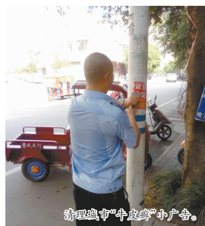
清理城市“牛皮癣”小广告。

开展城乡环境专项治理行动。县治理办强化城乡环境综合治理督查,督促乡镇、部门深入开展“三线”环境、非正规垃圾堆放点专项整治,加大宣传力度,营造全民参与环境卫生治理氛围,推进农村生活垃圾分类工作,开展全民大扫除和清洁行动。