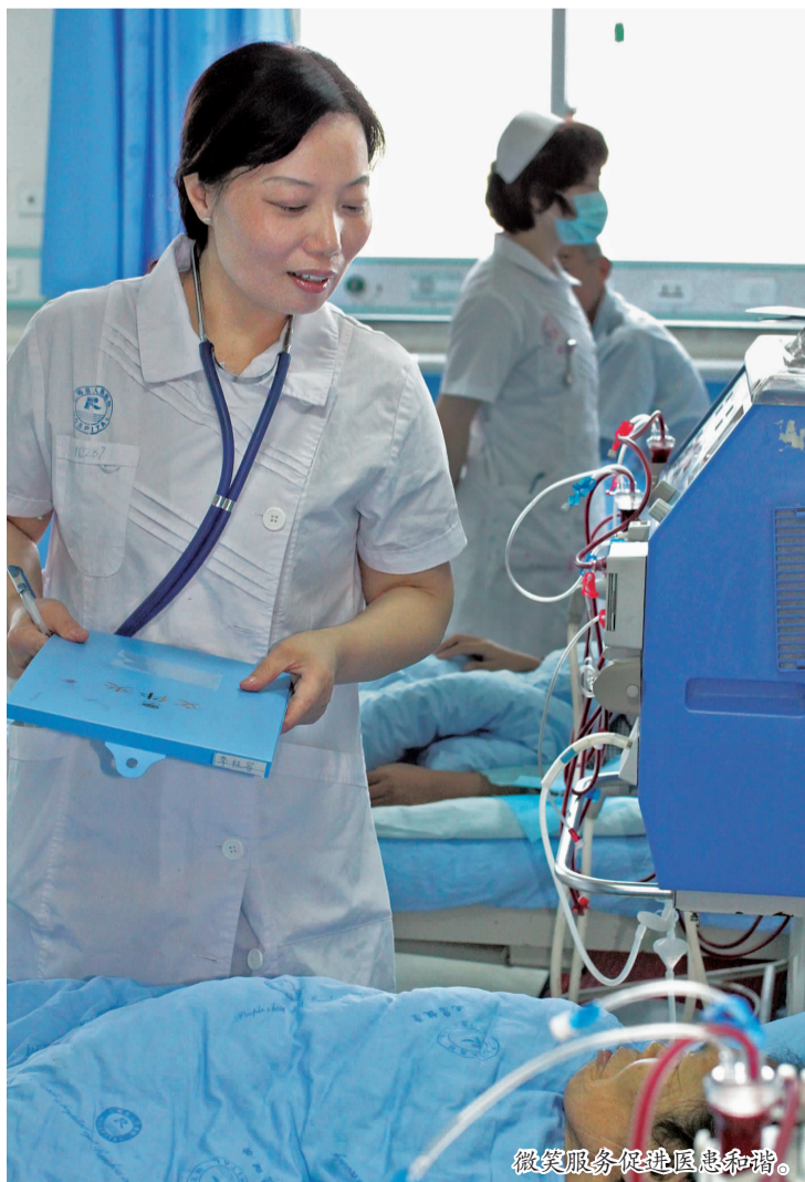
微笑服务促进医患和谐。

率先开展了不规则肝叶、胰十二指肠、卵巢囊肿、子宫肌瘤切除术等一系列微创外科手术,常规开展了全髌人工关节置换术、断肢再植术、心脏起搏器植入术、冠心病介入术等难度较高的先进治疗技术,努力为患者提供更加优质、安全、有效、便捷的医疗服务。目前全院有一级临床科室14个,二级专业组14个,医技科室11个。其中肝胆外科已通过省级重点专科验收,肾内内科、重症医学科为省级重点专科建设项目。