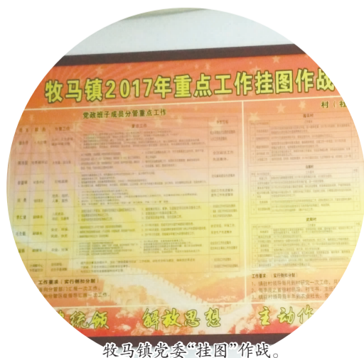
牧马镇党委“挂图”作战。