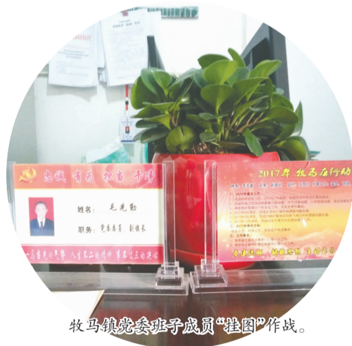
牧马镇党委班子成员“挂图”作战。