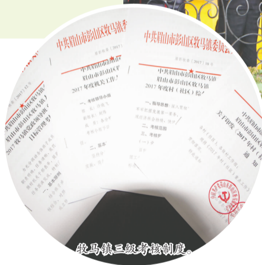
牧马镇三级考核制度。