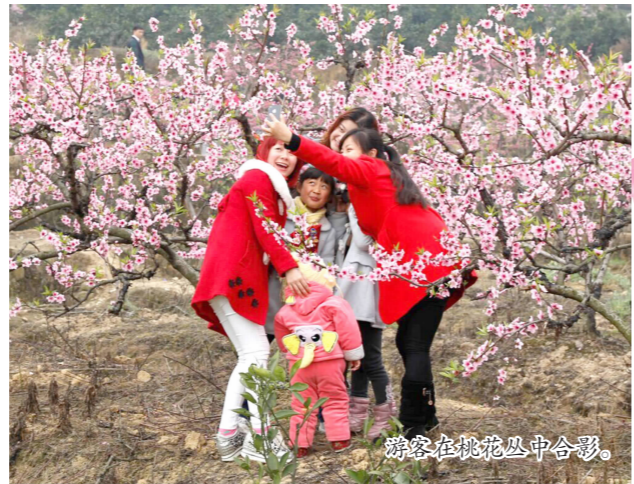
游客在桃花丛中合影

广济乡鸭池村被评为全国农业旅游示范点，白马镇、广济乡、悦兴镇、三苏乡等被评为全省乡村旅游示范区，悦兴镇元宝村、广济乡鸭池村、三苏乡陈沟村等被评为全省乡村旅游示范村，白马镇被评为全省两个乡村旅游标准化示范村之一。全区有三星级以上农家乐（乡村酒店）10多家，其中五星级乡村酒店2家、五星级农家乐1家。