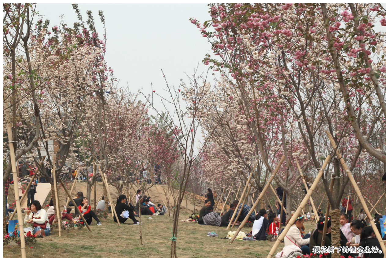
樱花树下的惬意生活