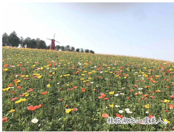
桂花湖冰山虞美人

充分发挥政府引导作用，在规划蓝图下，以乡镇为主体，旅游部门为协调机构，按照“突出重点、注重特色、打造品牌”的原则，通过整合项目、引进工商资本等方式，发展壮大特色产业，优化旅游交通线路、完善旅游基础设施，每年集中力量着重打造一至两朵“金花”。目前，“五朵金花”乡村旅游区已初具规模，各具特色，每年吸引大批游客到此休闲观光。