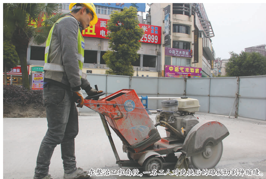
在整治工程中段,一名工人对更换后的路板切割伸缩缝。

服务品质和企业精神,赛出了积极、规范、专注、重细节、有凝聚力、执行力强的企业风貌。芭拉拉11年来一直是我市休闲服务行业翘楚,多年来持续为市民提供优质休闲产品。