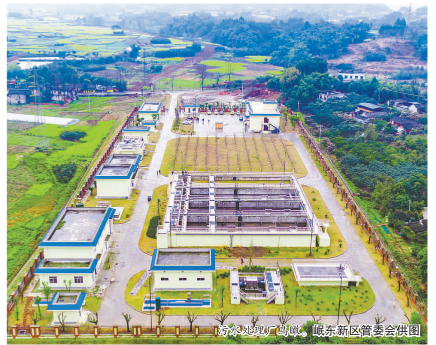
污水处理厂鸟瞰。

本报讯(记者 李勇军)近日,记者从岷东新区管委会获悉,我市岷东新区污水处理一厂已进入调试阶段,即将正式投入生产。