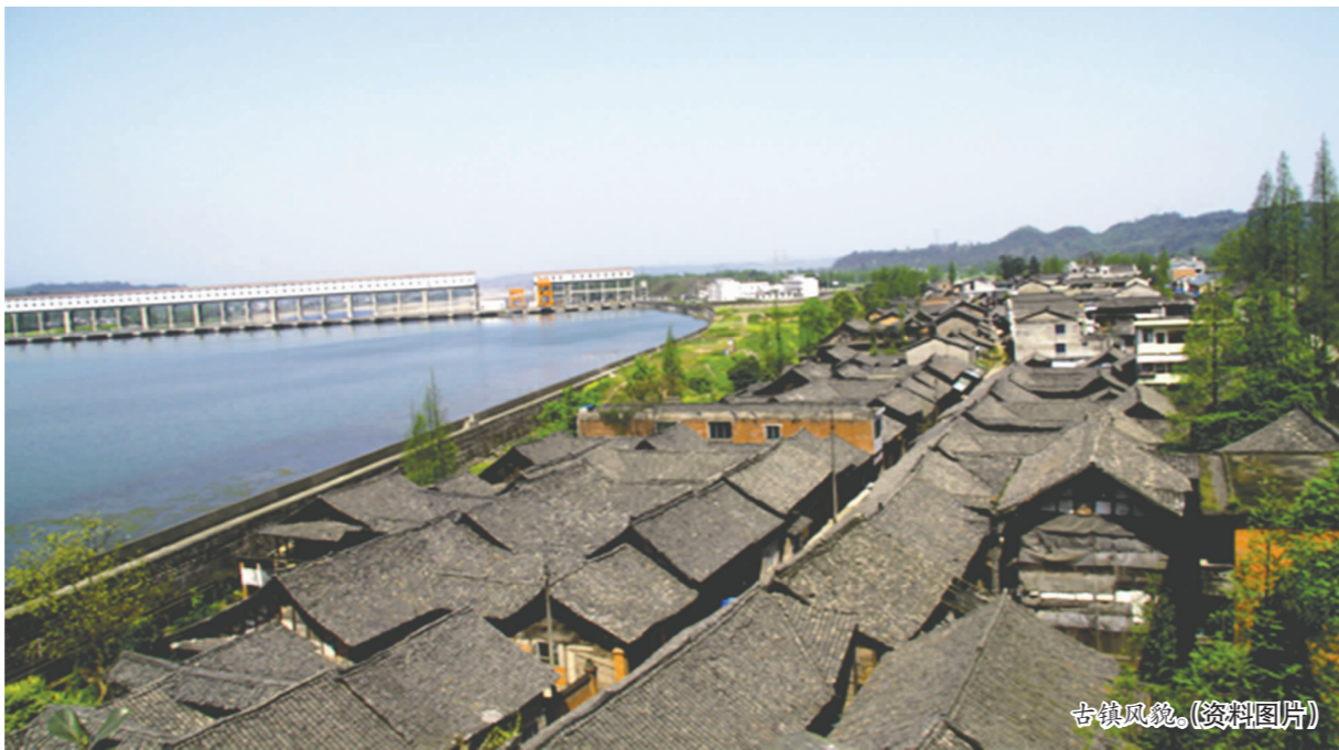
古镇风貌(资料图片)

2月6日,省发展改革委发布《四川省“十三五”特色小镇发展规划》,明确提出在2016-2020年规划期内,要大力培育发展200个左右类型多样、充满活力、富有魅力的特色小镇。特色小镇分为旅游休闲型、现代农业型、商贸物流型、加工制造型、文化创意型和科技教育型六大类。洪雅县止戈镇成为全市唯一一个列入文化创意型特色小镇。那么,止戈有何独特魅力,又为何受到如此青睐?