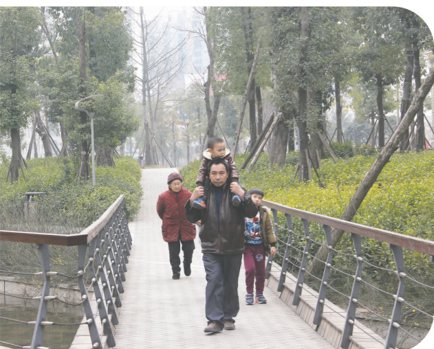
水体公园,森林进城。