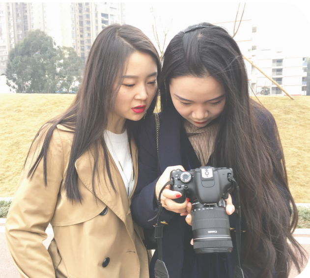
寻觅风景的女孩成为风景。