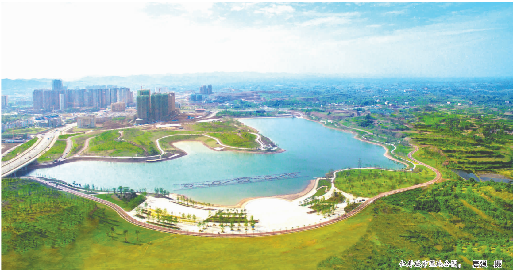
仁寿城市湿地公园。