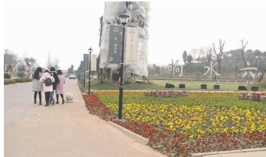
响水六坊,鲜花绽放。