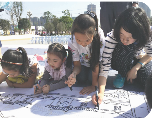
公园,文化,孩子们的乐园。