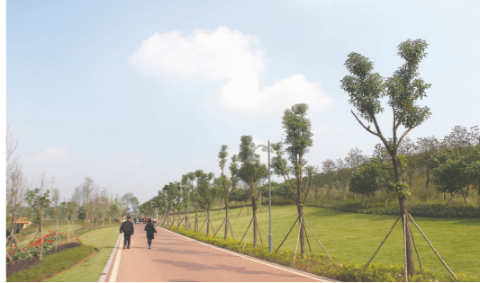
湿地公园,晴朗午后。