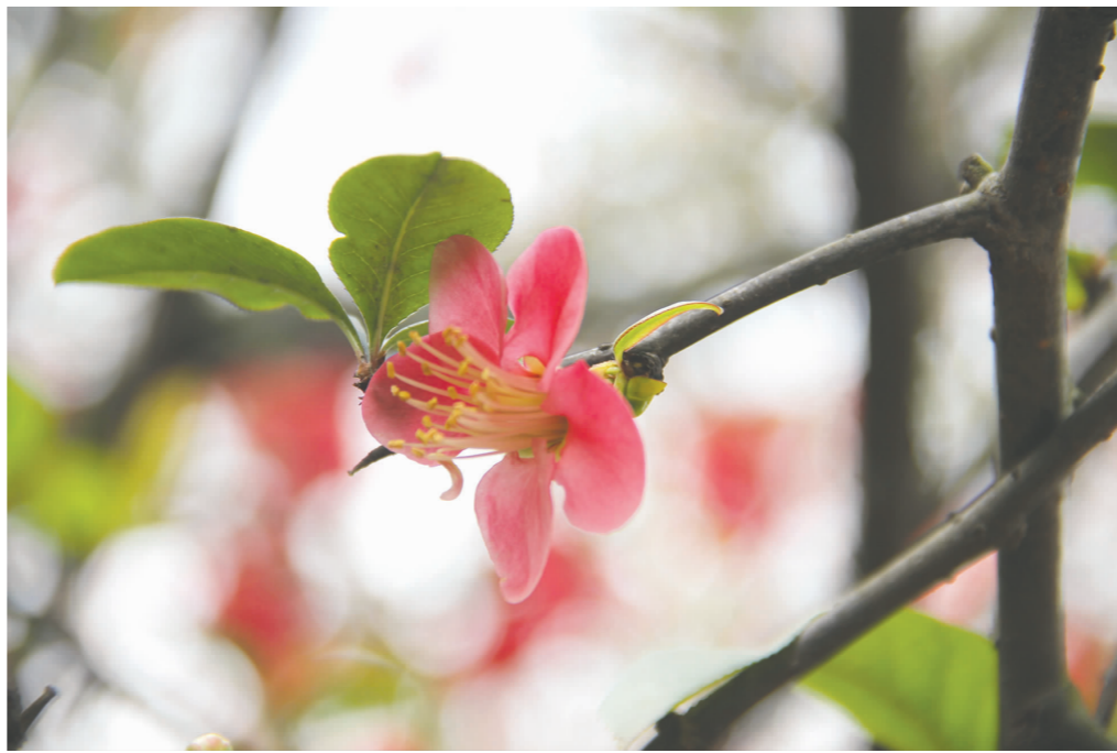
人民公园的海棠花开了。

高楼林立的现代化进程越来越快,在仁寿,公园成为了不可或缺的点缀,在拥挤中她们静静占有一席之地,在时间里她们慢慢见证着变迁。多年后,一汪清水、一条曲径、一棵老树、一条石凳,都能成为弥足珍贵的回忆。