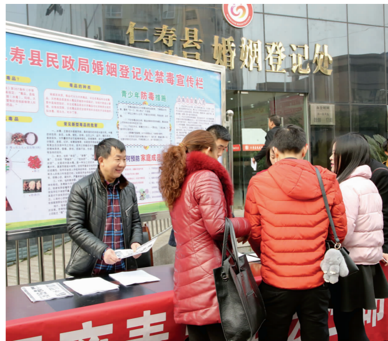
春节前后,仁寿县民政局充分利用春节期间外出人员返乡过节、办理婚姻登记等时机,在婚姻登记处开展了为期一个月的禁毒宣传教育活动。图为活动现场。