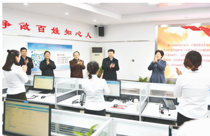
李静一行调研“12345”市党务政务服务热线平台。

调研中,李静代表市委、市人大常委会、市政府、市政协对过去一年全市各级各部门广大干部职工所做的工作表示肯定,对他们为全市经济社会发展