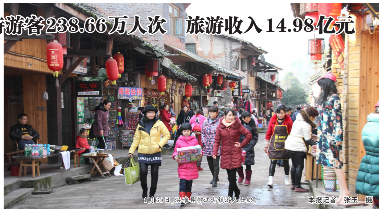
1月30日,洪雅县柳江古镇游人如织。

春节期间,全市景区景点精心部署、紧密配合,通过特色旅游产品、旅游节庆活动、旅游惠民措施、旅游市场综合整治等,营造了浓郁的节日旅游氛围,促进了市民在春节期间由传统的“走亲串户喝酒”向“旅游度假过节”新时尚的转变。节日期间,全市主要景区景点车如流、人如潮,但秩序井然、安全祥和,实现了春节假日旅游“安全、秩序、质量、效益”四统一的目标。各区县和景区因地制宜,紧扣节日主题,瞄准游客需求,融“文化性、趣味性、参与性”三位一体,纷纷推出年味浓郁的迎春主题活动60余个,共吸引了游客50多万人次参与体验,营造了浓郁的节日旅游氛围,提高了假日旅游综合效应。仁寿县湿地公园举办观花灯猜灯谜活动在除夕当天就吸引游客3.5万人。