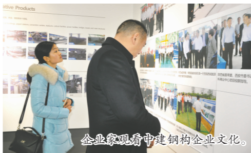
企业家们在中建钢构企业文化。