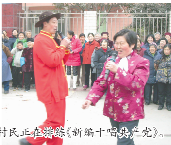
村民正在排练《新编十唱共产党》。

化生活,营造和谐、喜庆的节日氛围,凤陵乡9个村的群众正在排练2017年春节联欢系列文艺节目,将在农历正月初一为全乡人民献上一场丰富的文艺盛宴。