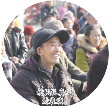
村民认真观看春联。