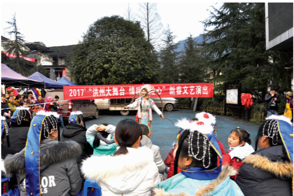
非物质文化遗产川剧表演。

本报(余静 记者 李泓莹 文/图)“快走,快走,快点到广场去,听说今天有文艺下乡表演,还赠送春联。”1月12日,洪雅县2017年“洪州大舞台 情暖百姓心”新春文艺演出,在该县高庙镇花源村和花溪镇鲜沟村上演。