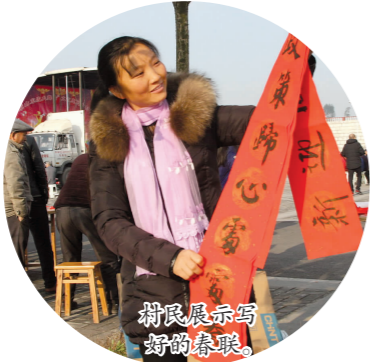
村民展示写好的春联。