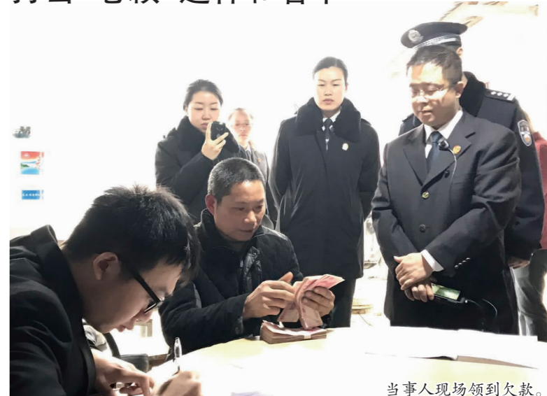
当事人现场领到欠款。

本报讯(古笑言 记者 李幸文/图)近日,我市两级法院执行干警同时出动,奔赴全市各执行现场,以雷霆之势打击“老赖”。