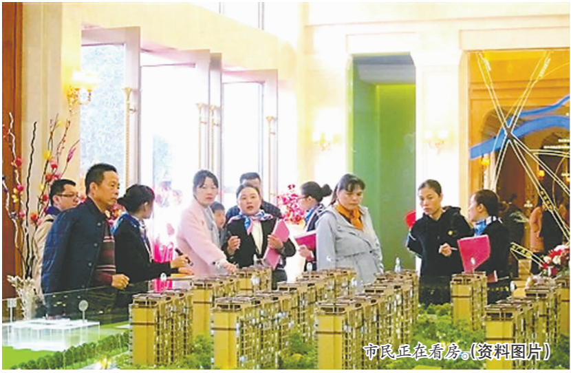
市民正在看房。(资料图片)

临近岁末,眉山楼市频频上演精彩大戏。众多楼盘纷纷举办各种营销活动,比如购房抽大奖、楼盘实景公开、产品发布会等,持续吸引购房者的眼球。对此,业内人士表示,面对激烈的市场竞争,开发商已经开始了年终最后冲刺。