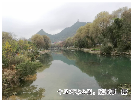
十里河滩公园。