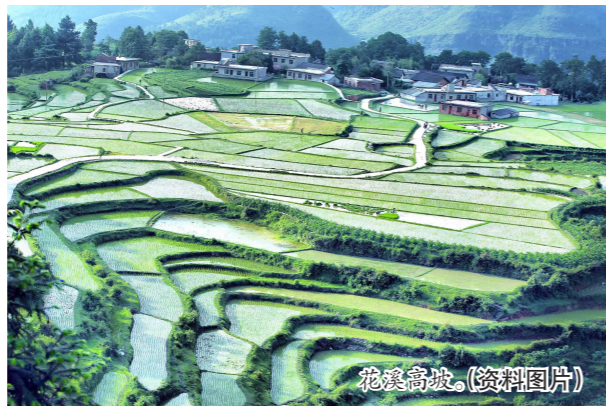
花溪高坡。(资料图片)