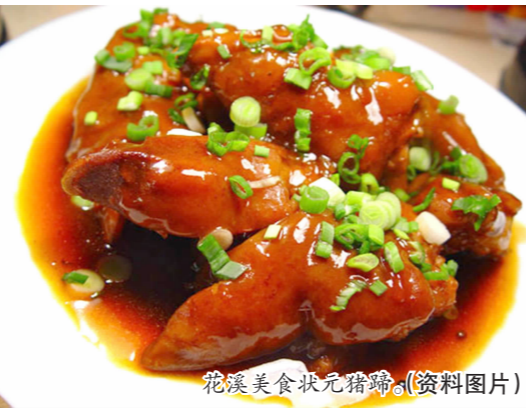
花溪美食状元蹄。(资料图片)