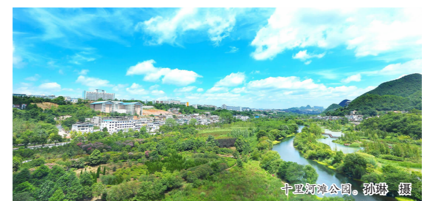
十里河滩公园。

平均海拔1500米,境内最高处皇帝坡海拔1712.1米,也属典型的高寒山区。高坡居住着汉、苗、布依等民族,苗族占全乡总人口的71%。这里每年有正月跳场、苗族“四月八”、斗牛节和吃新节等民族节日,每到这些节日,都要举行赛马、斗牛、对歌和芦笙会。在高坡,还有代表古代苗族独特葬俗文化的洞葬和悬棺,其中最著名的是甲定洞葬,洞高20余米,内有100多具棺木,全部放在井字形的木架上,层层叠叠,很是壮观。此外,在高坡陡峭的悬崖绝壁的石缝中还安放有古人的棺木,现今能看得到的有水塘村的悬棺。当年的先民为何要将棺木放置于此,又是怎样放上去的,至今都是一个谜。 (本报记者 姚永亮 底泽厚 整理)