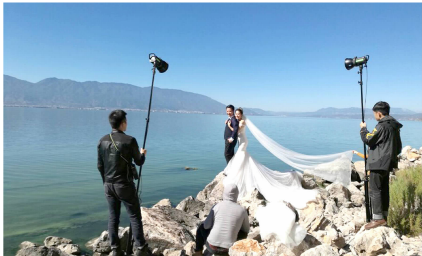
一场奋不顾身的爱情,一次说走就走的旅行——两样都齐了。火枫摄于云南大理

有位哲人说过,并非生活缺少美,而是我们缺少发现美。即便是一块丑石,在有心的眼中也会看出别样的美。其实美就在我们身边,只是我们的双眼被各种各样纷纷扰扰的思绪、各种各样花里胡哨的“包装”所迷惑,而视而不见,而难以认同。所谓“山不在高,有仙则名;水不在深,有龙则灵”山水的名灵,全在主观因素使然。一个心灵洁净的人,一山一水、一草一木都能在他心中激起美好的情愫,这山水、这草木无论有名无名,名声大小。更何况,在我们的身边也不乏名山、名祠、名湖、名人、名园等等。如此丰富的人文景观和自然景观,理应使得我们的心向往之。