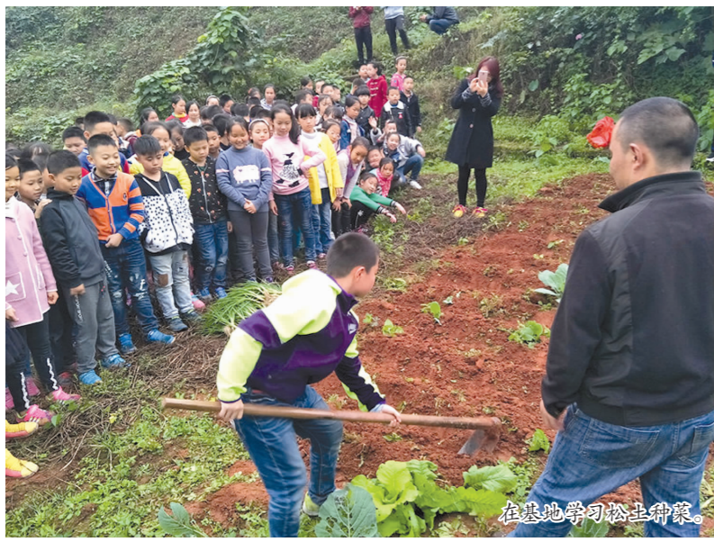
在基地学习松土种菜。

本报讯(高俊俊 欧翔 邓时俊 记者 黄馨月 文/图)近日,随着青神县学道街小学6年级(5)、(6)班120名小学生顺利步行7.5千米从基地返回县城,该校乡村少年宫2016年秋季学生基地实践活动圆满收官。在为期一个半月的时间里,学道街小学乡村少年宫3至6年级24个班、1200余名小学生分12轮完成“往返行军、内务训练、参观访问、认识植物、登山锻炼、协作划船、煮饭炒菜、野炊包饺子、应急避险、松土种菜、攀岩练志、钓鱼写生、制作标本、铁环比赛”等20余项特色实践活动,学生综合素质、体能意志得到全方位锻炼和提升。