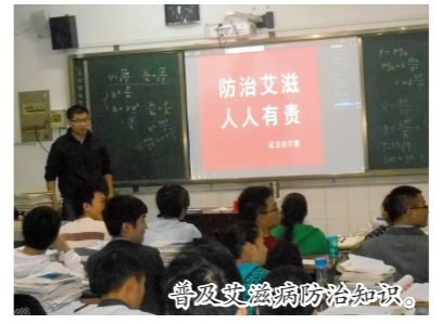
普及艾滋病防治知识。