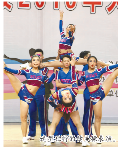
造型独特的健美操表演。