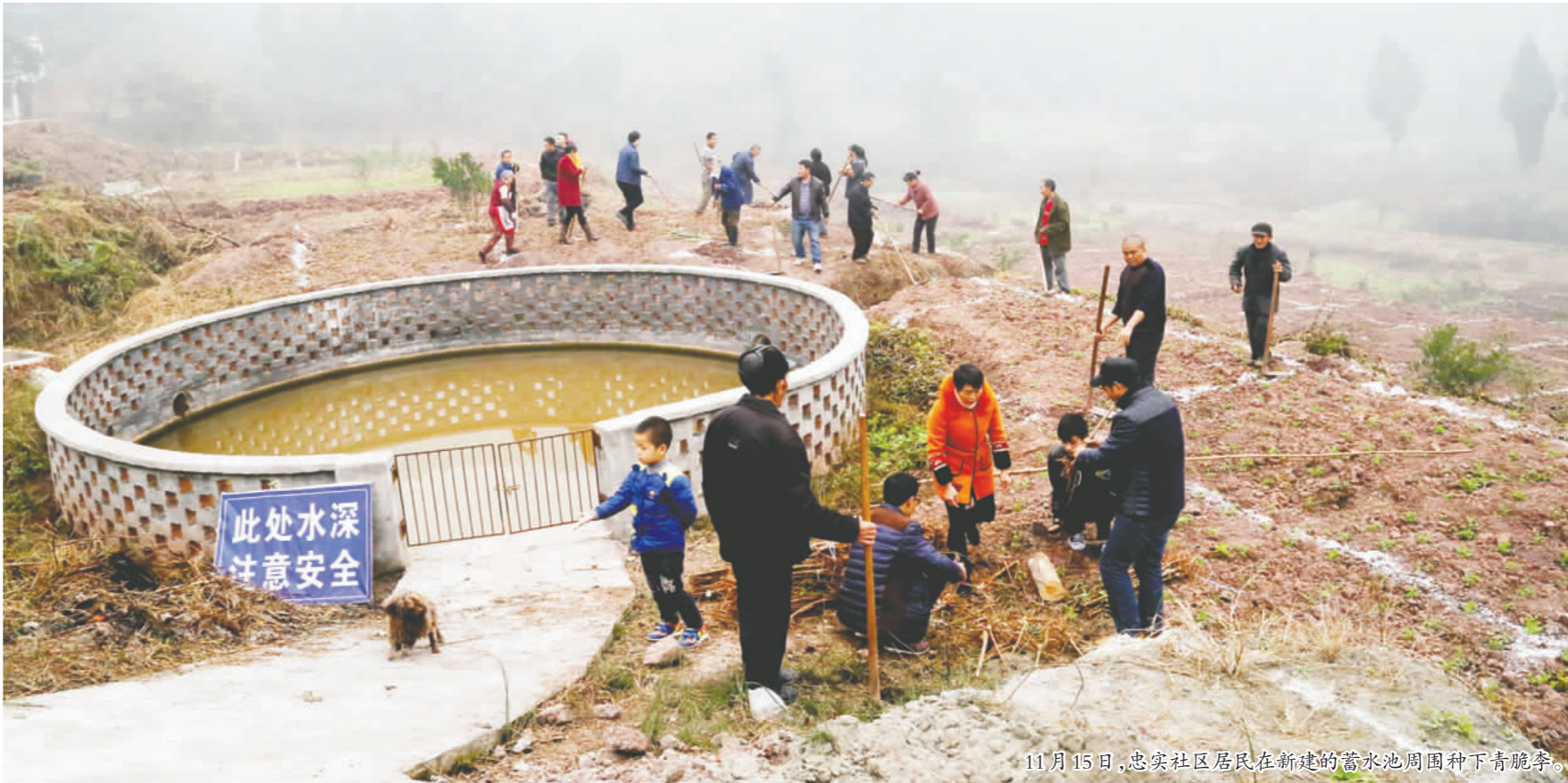
11月15日,忠实社区居民在新建的蓄水池周围种下青脆李。

为了有效解决建档立卡贫困户的住房难,仁寿县采取“易地搬迁、投亲靠友、进城入镇”等3个办法,并根据每户贫困户的不同情况给予相应的政策扶持和资金补贴。目前,此项工作正在加紧进行调查、核实、申报等前期准备。