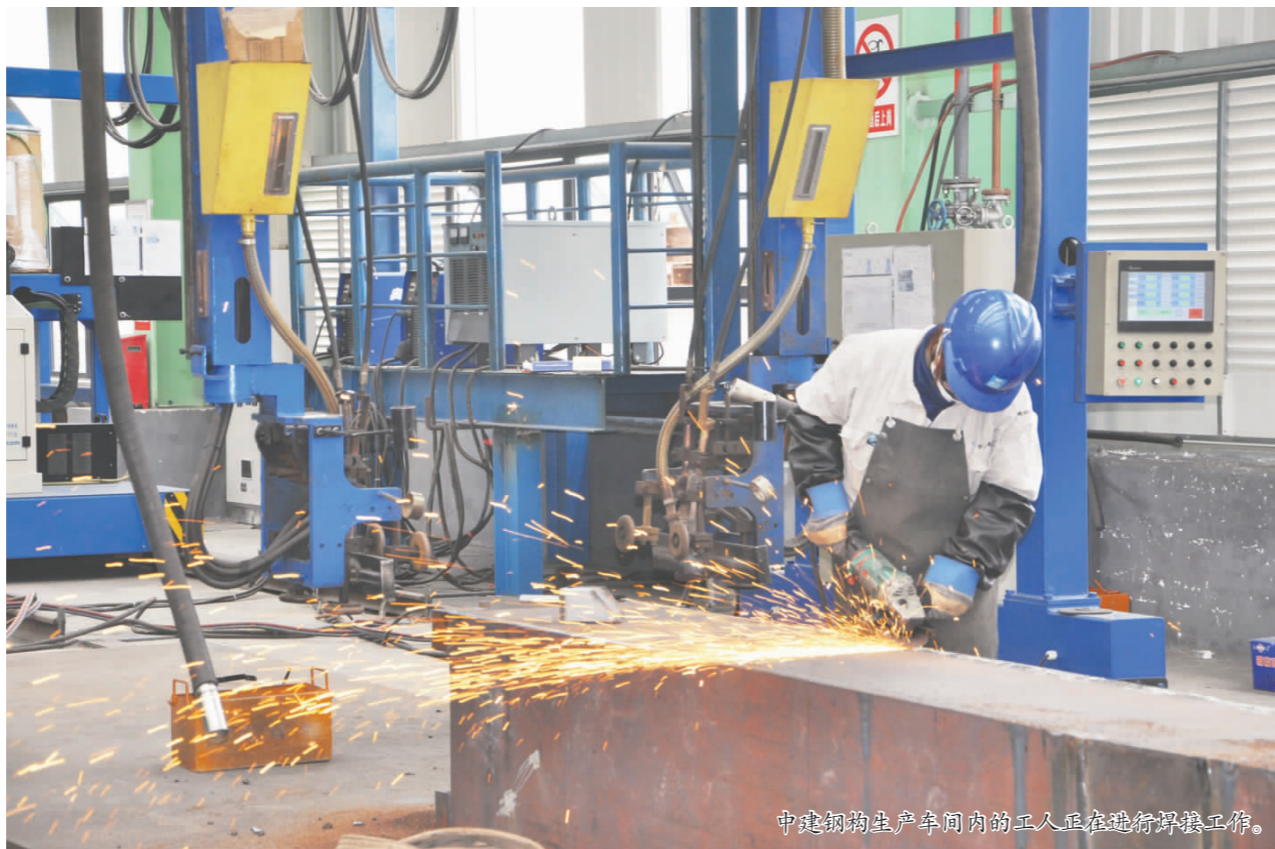
中建钢构生产车间内的工人正在进行焊接工作。

重大交通基础设施建设的集中发力，将引导成都向南发展。区域交流合作的扩大深化，将使得仁寿全面融入成都平原经济区。仁寿区域发展，正在向东、南、西、北不同方向辐射；向北沿天府大道、红星路南延线融入成都，实现同城发展；向东主动