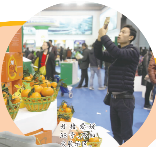
丹棱爱媛38号,不知火展示区。