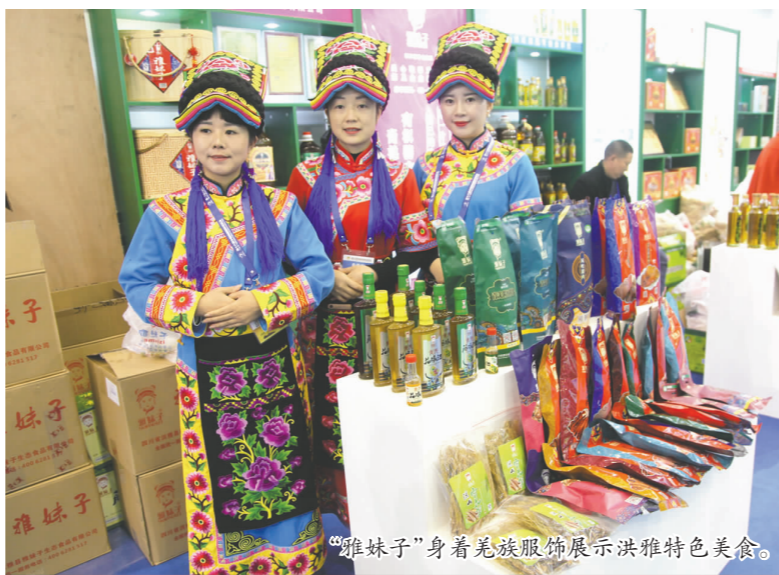
“雅妹子”身着羌族服饰展示洪雅特色美食。

除此之外,青神的柑桔、丹棱的爱媛38号、仁寿的芝麻糕、枇杷汁等,都十分受大家的欢迎。