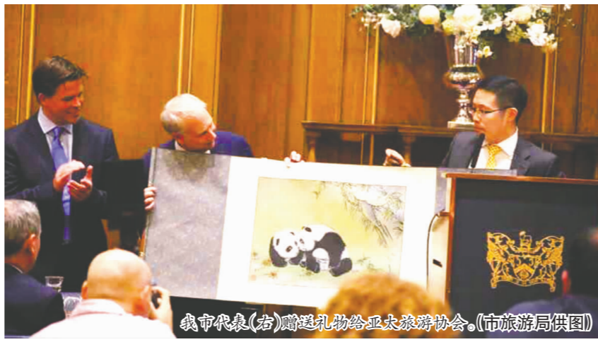
我市代表(右)赠送礼物给亚太旅游协会。

近年来,我市以东坡文化为核心,绿色生态为基础,景区景点为重点,着力推进旅游目的地建设,旅游发展迅猛,亮点纷呈,受到旅游界瞩目。今年8月,我市就积极组织申报了亚太旅游协会(PATA)2016年新兴旅游目的地挑战项目。此次被评为亚太地区2016年新兴旅游目的地挑战项目(二三线城市)首选旅游目的地,意味着我市同时获得了价值50万美元的数字营销活动以及2017年在斯里兰卡尼甘布举行的亚太旅游协会峰会和亚太旅游协会旅游交易会的参会资格。