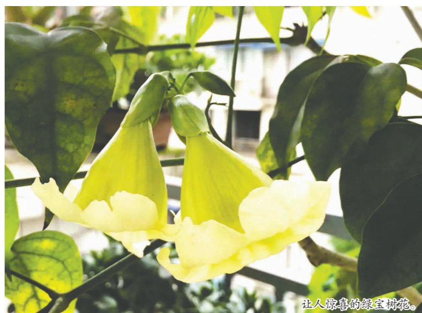
让人惊喜的绿宝开花。

就在这时,我发现一些茶树上竟挂着黄白色的什么。我好奇地凑近一看,一朵朵精巧的小白花带着黄蕊藏在绿色枝叶中,星星点点地开放着。茶树也会开花?不仅是只见过夏天茶树的我不知道,很多人也未曾留意吧。朋友直笑我没见过世面,带我来到屋后的斜坡上的茶园。我不禁惊呼,在这片绿茫茫的茶园中,一垄一垄的茶树都开出了黄白色的花朵。微风拂过之时,那饱满的金黄色花蕊轻轻颤动,在风中摇曳纤细的身姿。不时有蜜蜂被引来,惬意地花