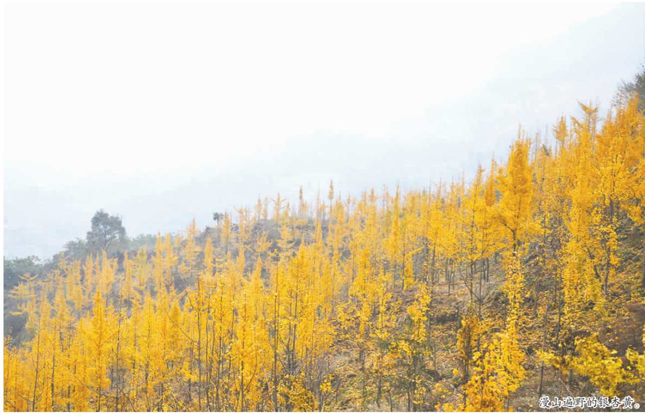
漫山遍野的银杏黄。

本报讯(记者 张玉 文/图)11月7日,丹棱县顺龙乡近万亩银杏林满目金黄,形成了5公里的银杏走廊观光带,引来大批游客赏景。