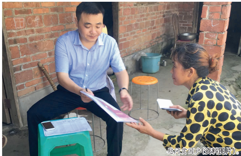
慰问贫困户(资料图片)。

(上接第一版) “我局坚持把基础设施建设作为改善群众生产生活条件的根本途径，不断夯实基础设施建设。”东坡区教育局相关负责人介绍说，2011年，该局出资2万元帮助泥河村1组新修了690米的水泥路；2013年4月，该局出资2万元，帮助泥河村新建了长8米、高3米的村务公开栏；2014年12月，该局出资2万元，帮助泥河村硬化了450平方米的活动场地，积极协调该区文体局，新添了单杠、双杠、篮球桩、乒乓球台等健身器材，使村民有了舒适的活动健身场所；2015年，该局出资1.2万元帮助泥河村完成了1、2、8、9