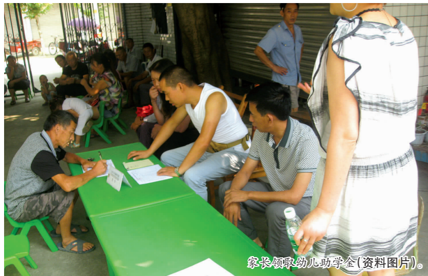
家长领取幼儿助学金(资料图片)。