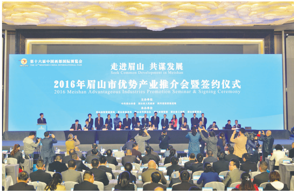
眉山市优势产业推介会暨签约仪式现场。

本报讯(记者 王磊)在第十六届中国西部国际博览会即将开幕之际,昨(2)日,“走进眉山 共谋发展”2016年眉山市优势产业推介会暨签约仪式在成都举行。这是我市贯彻落实省委、省政府“项目年”要求部署,充分利用西博会平台,大力推进招商引资项目的又一具体行动。省委常委、组织部部长范锐平出席仪式并见证项目签约,省委副秘书长、省信访局局长邵军军出席仪式,省投资促进局机关党委书记吴燕翔在仪式上发言。