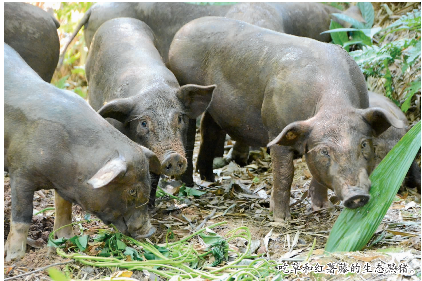
吃草和红薯藤的生态黑猪。