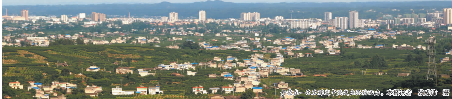
丹棱在一次次蝶变中焕发出强劲活力。

本报讯(刘强 记者 林茂春)为深入推进“两学一做”学习教育,丹棱县人社局创新方法,借助本部门微信公众平台,将“线上学”与“线下学”有机结合,切实增强了学习的生动性和灵活性。 据了解,该部门利用微信公众平台平台定期“推送”学习资料,及时发布相关知识等,丰富了“两学一做”学习教育的形式,使全体党员既能在党支部课堂上集中学习,又能利用空闲时间随时随地地学习,得到了全体党员的广泛好评。目前,该部门已通过微信公众平台推送“两学一做”各类信息20余条。