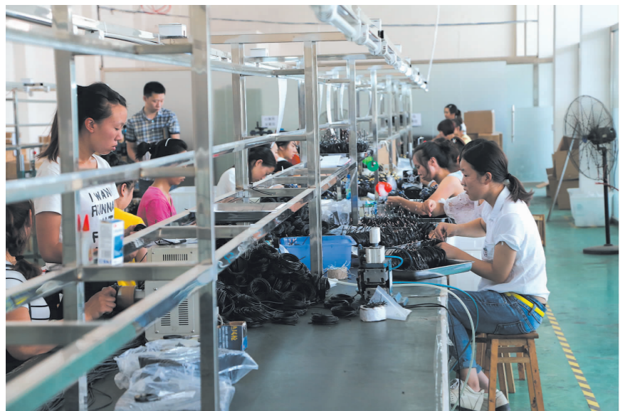
丹棱县机械产业园区某电子科技有限公司内,工人们正在抓紧生产。