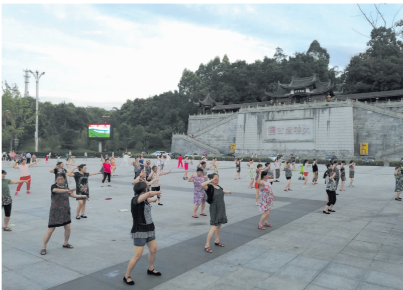
大雅广场成了市民休闲娱乐的好去处。

2015年5月12日,省委书记王东明莅丹棱调研时,充分肯定丹棱“县域经济有特色,小县大发展”。 “大发展”从何谈起?丹棱县始终坚持在继承中发展,在发展中创新,在创新中突破——成功创建为国家可持续发展试验区、国家级生态示范区、全国农村生态文明家园建设试点县、中国最大优质“不知火”生产基地,打造“中国齿轮之都”,丹棱小齿轮走向了大世界;纪念性恢复重建大雅堂;农村生活垃圾处理“丹棱模式”成为全国经验……事实证明,丹棱已在一次次蝶变中焕发出强劲活力,发展成果不断刷新,特色亮点层出不穷。