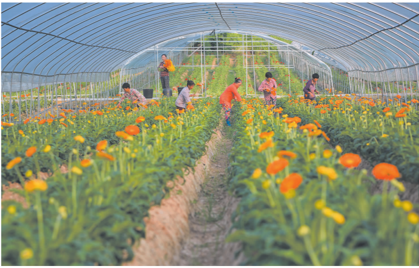
岷江现代农业园区明都花卉项目。

型经营主体,加快了农业转型升级,促进了农民有序转移,带来了先进的生产技术、先进的管理理念、优秀的人才团队和大量的资金投入,既促进了特色农业产业发展,又大力推动了一三产业融合发展。截至目前,园区核心村土地流转率高达95%,共引进培育北京富通公司、四川明都花卉公司、沈阳新隆嘉公司、彭山老农民家庭农场、彭山雪源农业专业合作社等新型农业经营主体129家,其中50亩以上的占40%、200亩以上的占50%、500亩以上的占