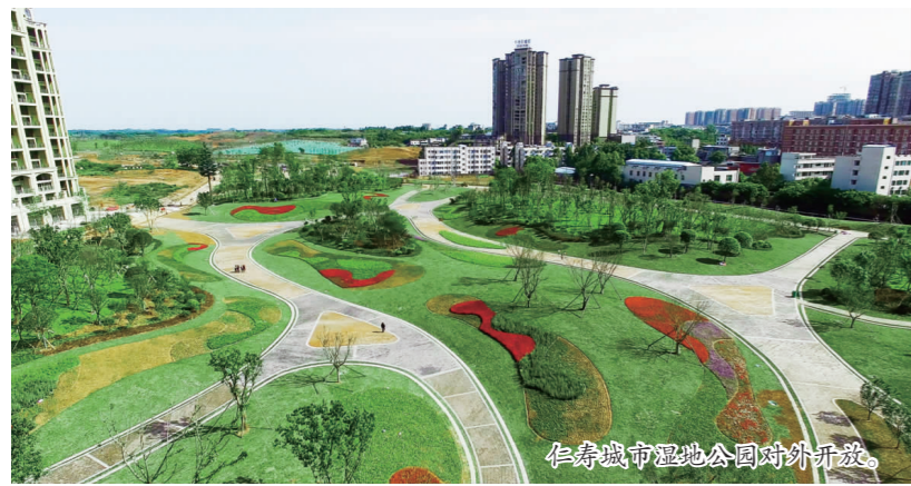
仁寿城市湿地公园对外开放。