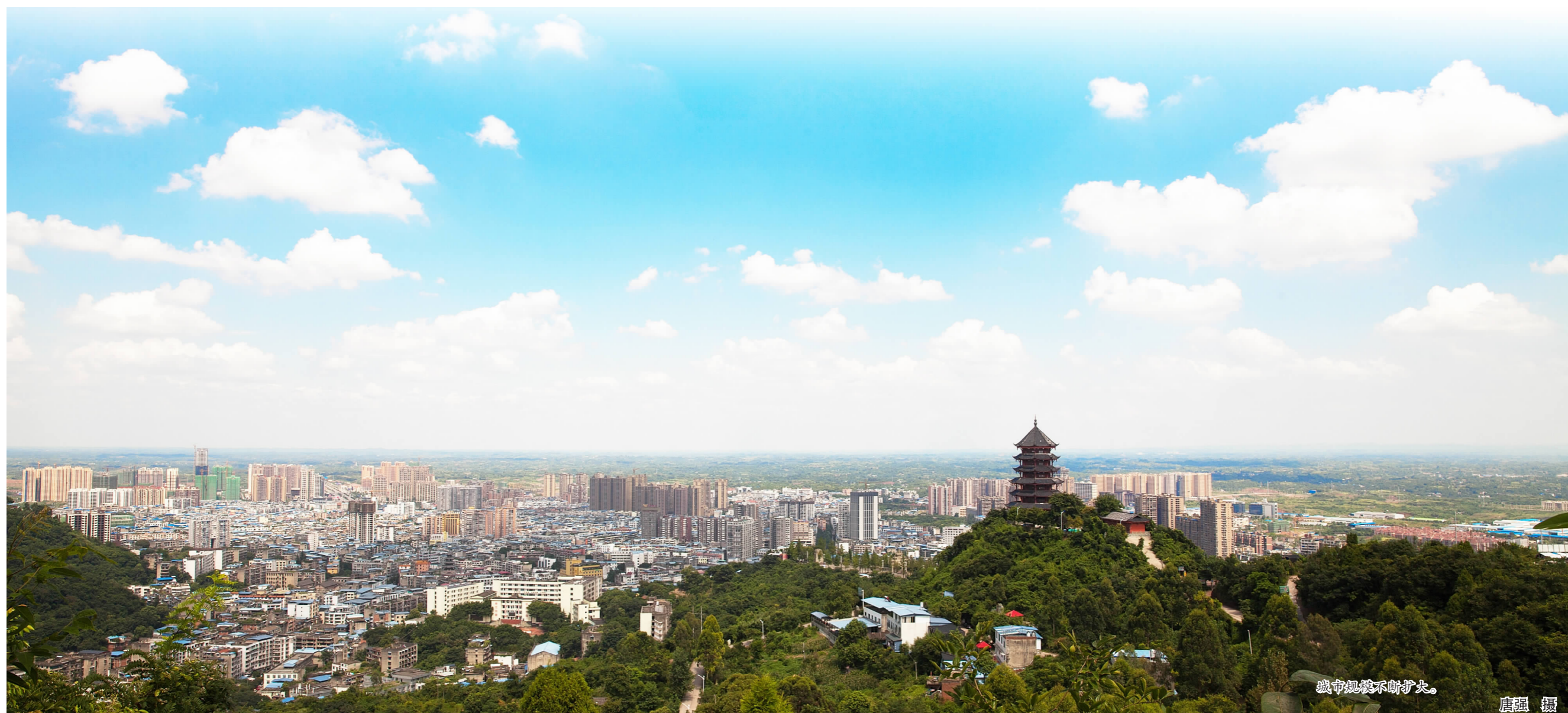
城市规模不断扩大。