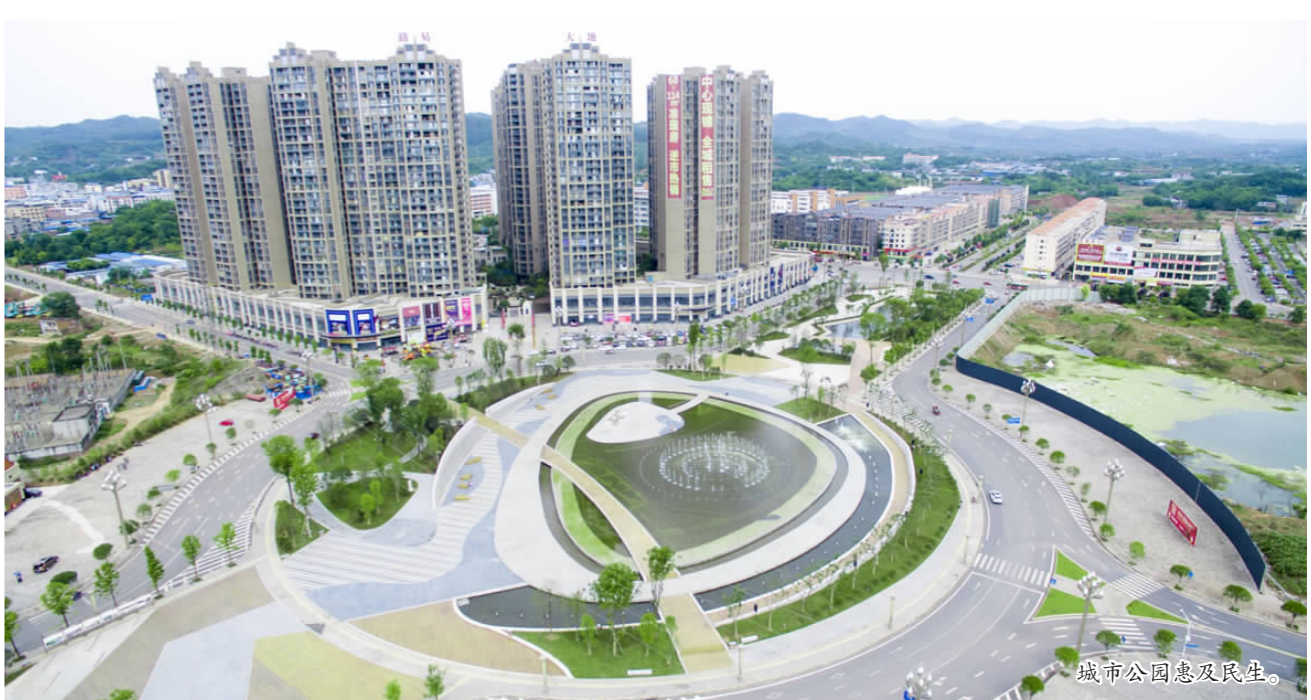
城市公园惠及民生。