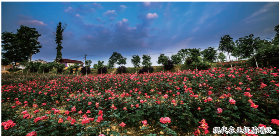
现代农业提质增效。