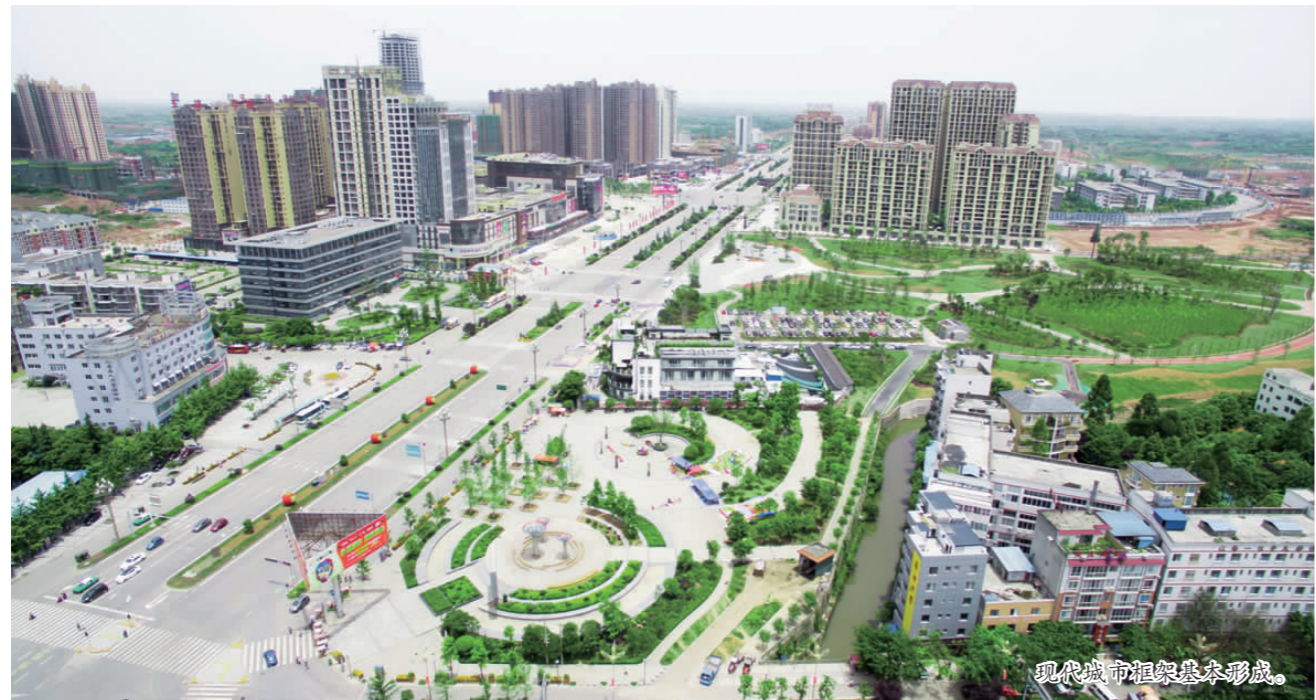
现代城市框架基本形成。

在脱贫攻坚全面推进中,仁寿县争取到省级扶贫资金1353万元用于228个村16322人产业发展,实现政策兜底17008人,完成就业培训3869人;争取各类扶贫资金21688.4万元,用于美丽乡村、农村道路、农田水利等基础设施建设;制定联系村帮扶计划276个,已完成帮扶项目66个;协调银行授信贫困户2803户,发放贷款5835.5万元;通过二、三产业扶贫,农民向二次产业和三产经营者、从业人员转变8037人,精准减贫305人。