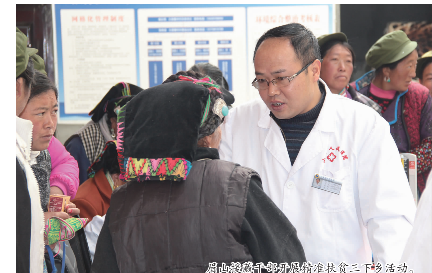
眉山援藏干部开展精准扶贫三下乡活动。