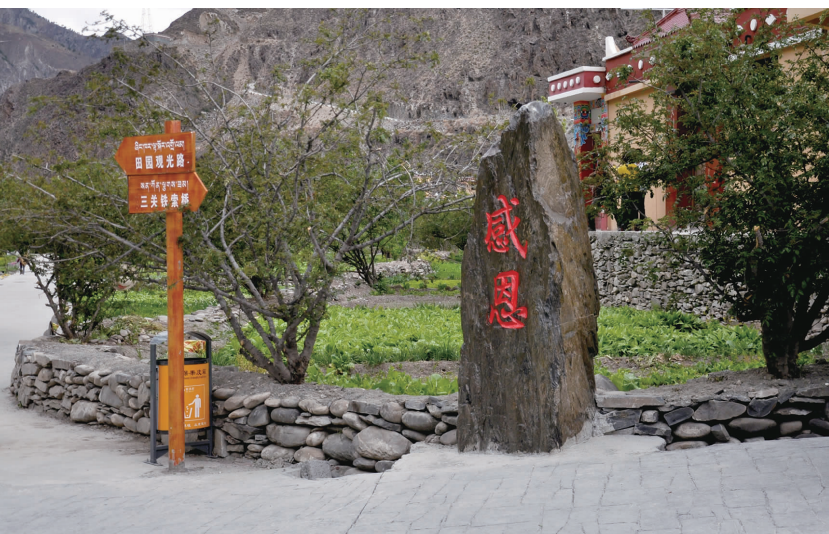
藏区干部群众为眉山援建树起的感恩碑。

小金川河边三关桥村,因古老的三关铁索桥与县城相连而得名。桥头堡上,当年红军刻的标语依然清晰可辨;累累弹痕,清晰地展示着红军长征途中的壮怀之旅。