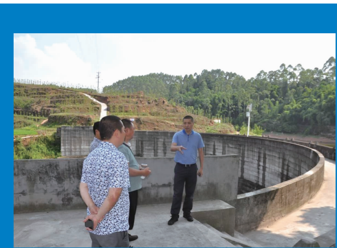
到辖区检查指导防汛度汛工作。