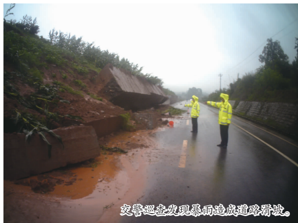
交警巡查发现暴雨造成道路积水。

全市公安机关积极行动,尽最大努力将洪灾损失降至最低,在“两学一做”学习教育活动中,以实际行动向党和人民交上了满意的答卷!