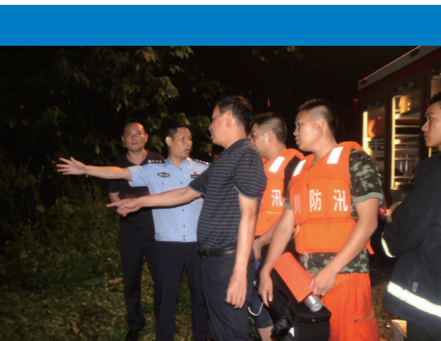
现场指挥救助被困群众。