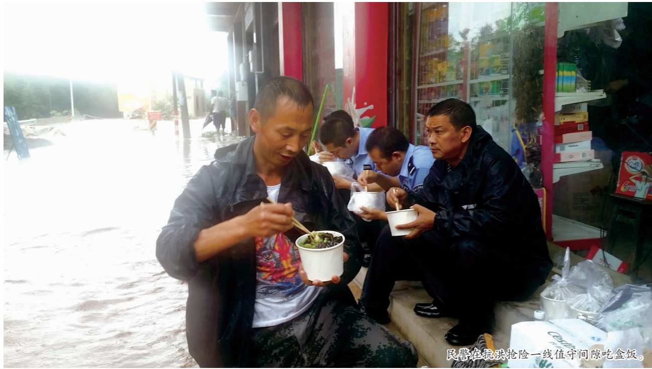
民警在抗洪抢险一线值守间隙吃盒饭。

7月上旬,我市遭遇今年入汛以来最大强度的暴雨天气,导致洪雅、丹棱、青神等区县发生不同程度的灾害损失。