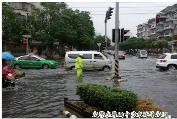
交警在暴雨中涉水疏导交通。