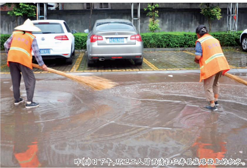
昨(6)日下午,环卫工人冒雨清扫仁寿县道路上的积水。