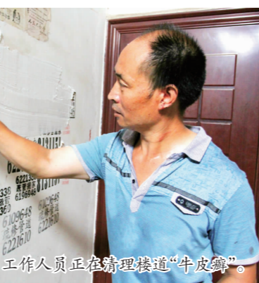
工作人员正在清理楼道“牛皮癣”。

本报讯(通讯员 潘建勇 记者 周婕妤 文/图)为积极响应仁寿县创建“省级环境优示范县城”活动的号召,解决社区脏乱差等突出问题,还居民一个整洁的生活环境,6月30日,仁寿县城陵州路社区组织专业人员对辖区内“牛皮癣”进行了清理。