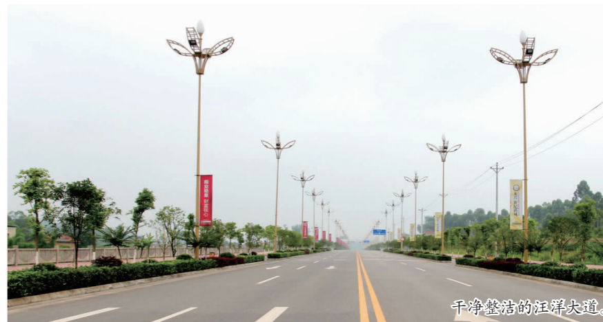
干净整洁的汪洋大道。

为进一步巩固省级环境优示范镇创建成果,有效提升镇镇形象,仁寿县汪洋镇按照“卫生治理日常化、秩序管理常态化”的要求,着力在构建城乡环境综合治理长效机制上下功夫,初步建立了一套行之有效的长效管理机制,彻底改变“治理—反弹—再治理”的不良局面,逐渐形成镇镇街道、城乡接合部、农村环境卫生治理并重的良好工作格局。