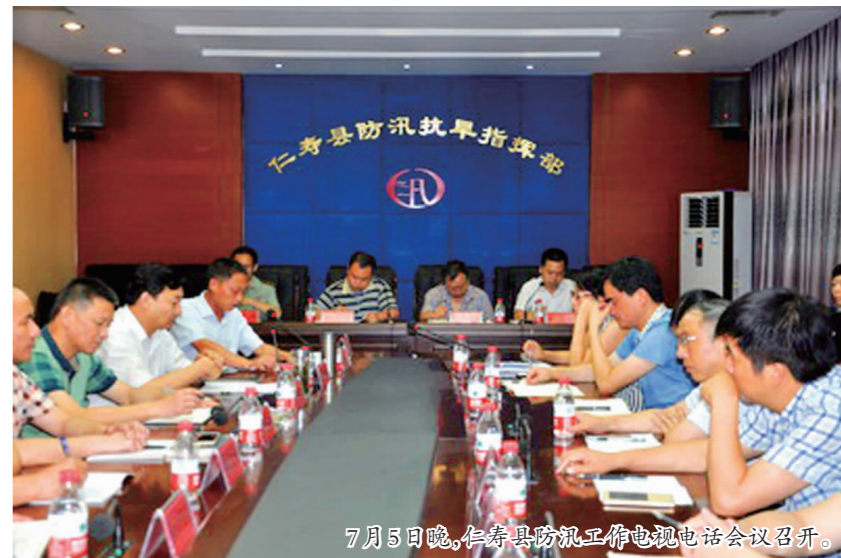
7月5日晚,仁寿县防汛工作电视电话会议召开。

加强市县天气会商,严格按照县防汛指挥部安排部署,24小时值班值守;启动短时临近预报,解决短期预报卫星资料精准度不够的问题,从而提高预报准确率;充分利用监测系统和观测网站,加密实况监测,提前发布预警信息,增强信息的时效性,提前锁定可能发生强对流天气的重点乡镇;加强与县防汛办及相关部门的信息联动,确保气象信息第一时间有效传达到相关防汛责任人和乡镇气象信息员。