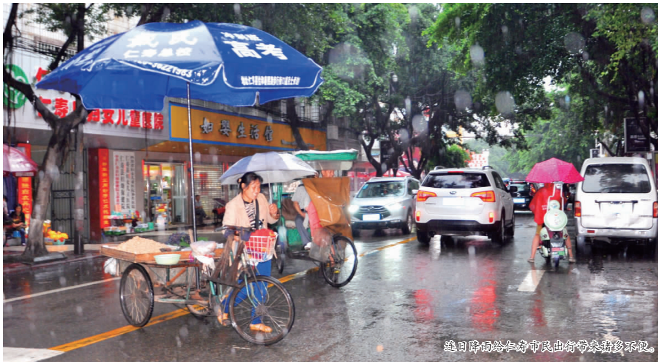
连日降雨给仁寿市民出行带来诸多不便。