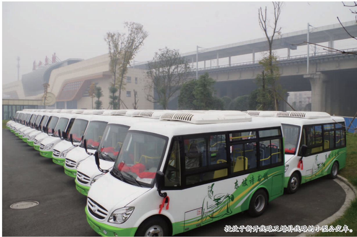
投放于新开线路及增补线路的小型公交车。

优化交通结构、提高公交分担率,是缓解城市交通拥堵的有效手段。近段时间以来,在一年一度的高、中考期间,我市公交为广大学子保驾护航,提供了一个畅通、高效、便捷的乘车环境。