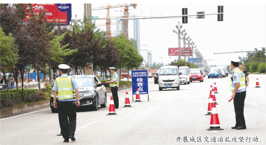
开展城区交通乱点整治行动。