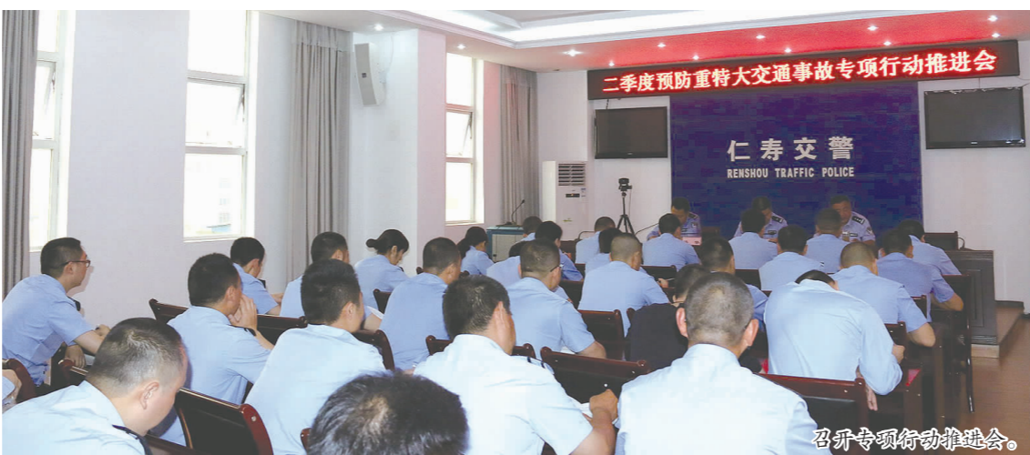
召开专项行动推进会。

该大队在原有各项规章制度的基础上，对值班备勤制度、请销假制度、卫生制度、车辆使用管理制度、综合业务绩效考核办法等进行了完善，建立健全了执法记录、接处警记录、枪支使用交接记录等台账，进一步激发了民警的工作热情和开拓进取精神。