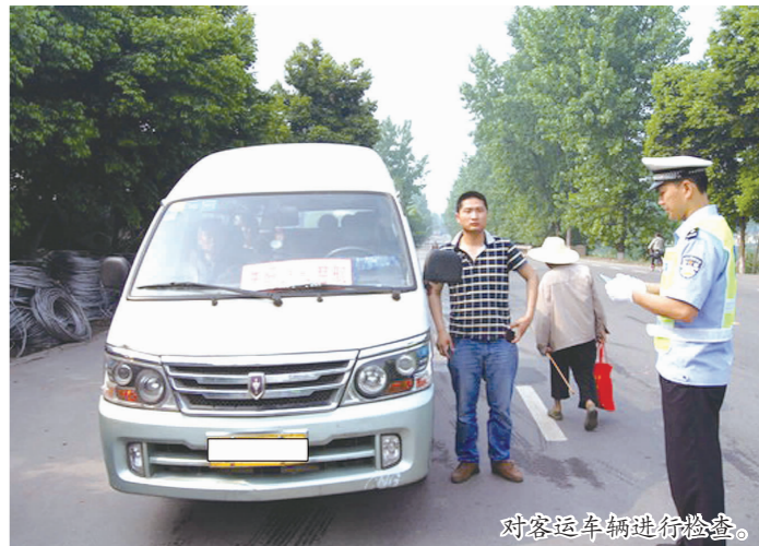
对客运车辆进行检查。