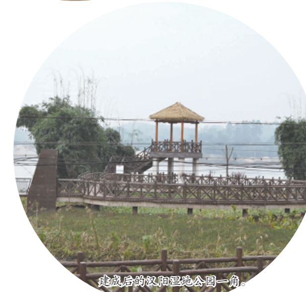
岷江彩虹桥湿地公园一角。