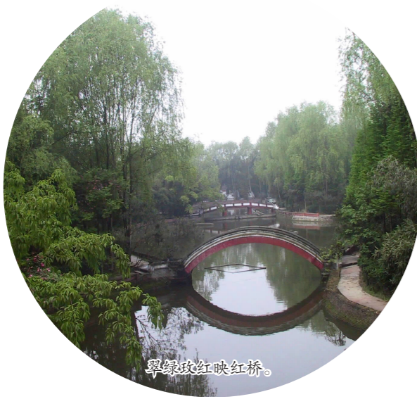
岷江彩虹桥。