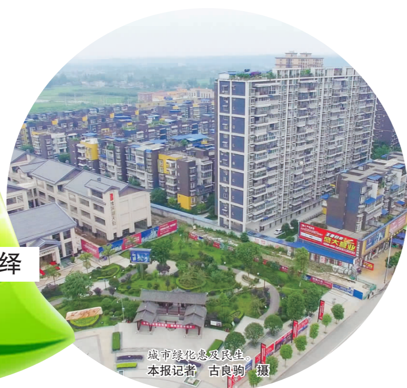
城市绿化理念良好

“百村绿色家园工程”建设成效显著。该县已完成了南城镇兰沟村、白果乡甘家沟村、西龙镇万沟村、汉阳镇新路村、高台乡百家池村等5个绿色家园村建设。在建设中,结合幸福美丽新村、新农村综合体建设和乡村旅游发展建设,以产业发展为基础,以新村建设为目标,以生态观光为依托,助推绿色家园建设,实现产村相融,绿色和谐。