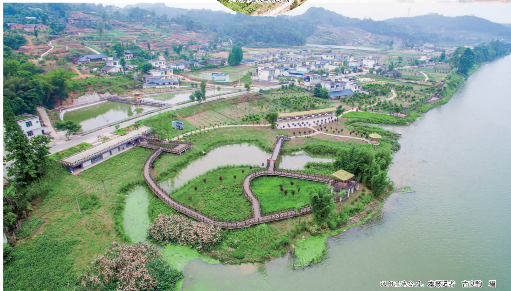
汉阳湿地公园。

据统计,“千湖之城”建设实施以来,青神县累计完成投资8.73亿元,累计新增和恢复蓄水能力1.05亿立方米,新增和恢复水域面积10.08平方公里,水域面积占国土面积比重由13%提高到15.3%。