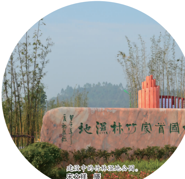
建设中的竹林湿地公园。