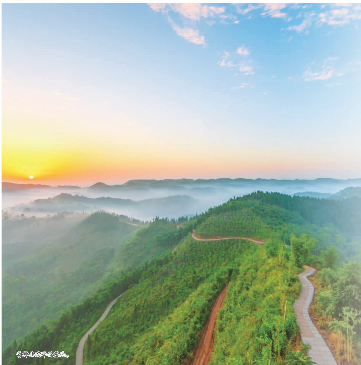
青神县岷江河畔湿地。