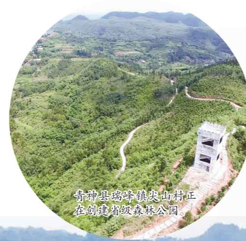
青神县岷江河畔正在建设中的森林公园。