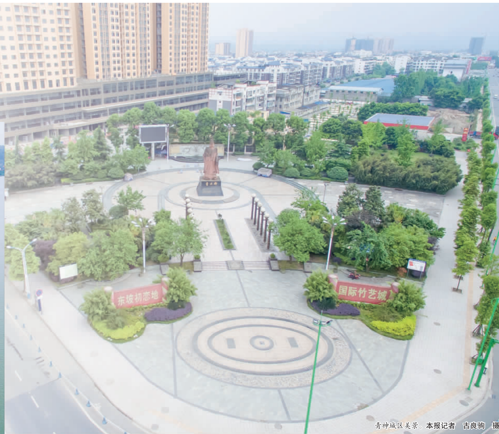
青神城区美景。