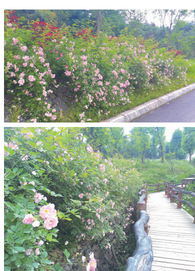
粉色蔷薇热烈明媚。