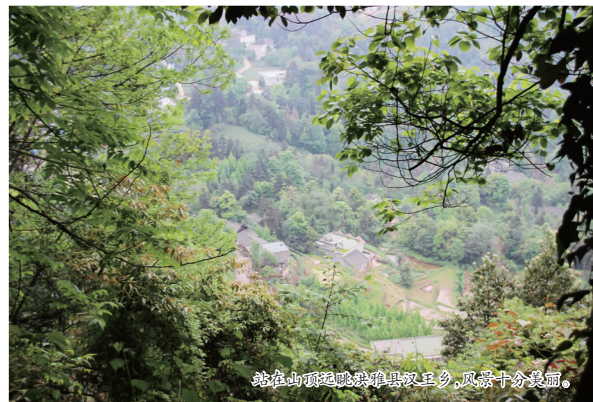
站在山顶远眺洪雅县汉王乡，风景十分美丽。

更让人惊喜的是，当我们到达山顶，果真发现了一处观景处，从这里可以看到汉王乡全景，一眼望去可以看到盘山路如蜿蜒的线条，随意自如地勾画在山间岩下。田边地角，房前屋后，以绿为背景，不知名的野花随意地点缀着大地，不远处的汉王湖里，成群的白鹭在青山绿水间飞翔，犹如仙境一般美丽，而我在汉王乡仿佛也感受到了悠然见南山的生活。