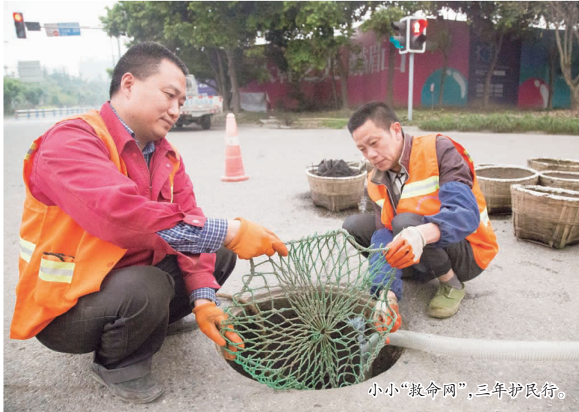
小小“救命网”,三年护民行。

根据分析,除了雨水会将路面尘土杂草垃圾树叶等杂物带入管道,造成堵塞外,个别沿街商户尤其是一些小餐饮业主存在不文明行为,图省事就会把一些泔水垃圾直接倒入管网,容易造成管网堵塞。所以,市政处向广大市民发出呼吁,为确保城市安全度汛,希望大家爱护市政设施,不要向下水管网中乱扔垃圾杂物。除了共同维护,市民也可以在城市出现内涝的同时,拨打热线电话38119999,描述有可能出现的城市内涝情况,以便市政处能够及时出动,解决视频监控和巡查盲区。