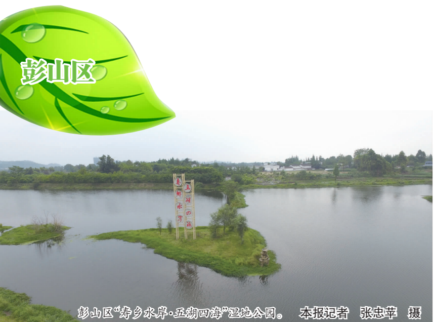
彭山区“舟乡水岸·五湖四海”湿地公园。

“三苏祠公园、东坡城市湿地公园、四大主题公园、东坡竹园等20余个城区公园正陆续建成。待到所有公园完美绽放,眉山城区必定更加美丽。”相关负责人介绍说。