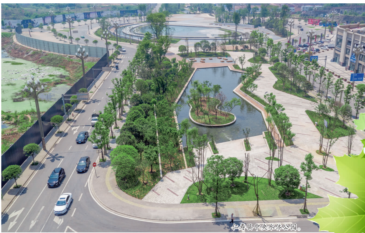
仁寿县湿地公园。

“仁寿的公园真多啊,我们生活在一座‘绿色福利’很高的城市!”近日,仁寿县文林镇居民于风仙带着家人来到刚建成的仁寿县湿地公园游玩,她说,如今逛公园已成了仁寿群众的一种生活方式和习惯。