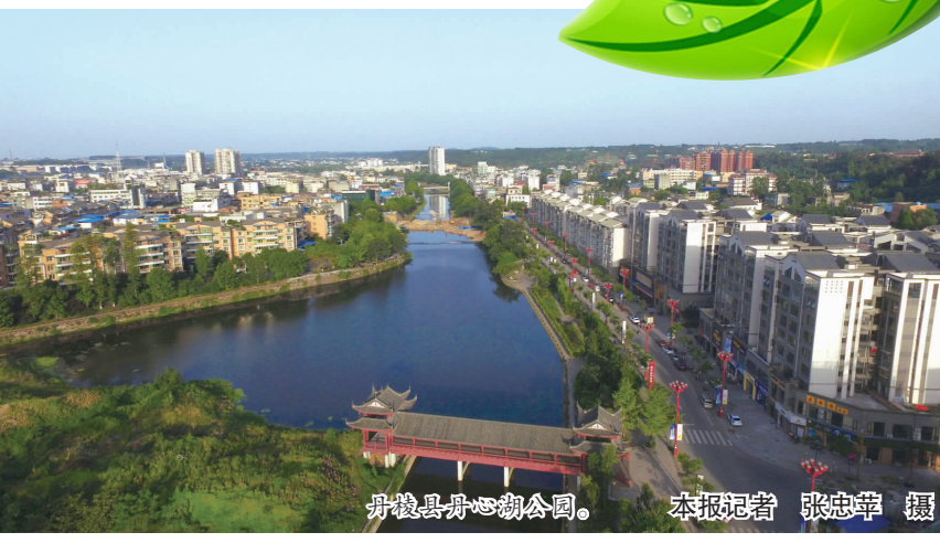
丹棱县公园。

“引青入城”项目,历经10多年的风雨历程,是全县群众多年以来的共同梦想,被确定为城市建设“一号工程”。它的建成,大大提升了洪雅的城市品质。”项目建设相关负责人表示。