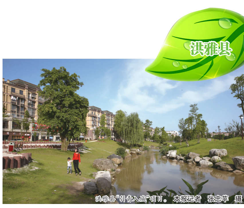
洪雅县公园。

丹棱公园位于丹棱县城,外西街以东,丹棱河围合地块,整个公园三面环水,主要包括75亩开放式城市公园、1500平方米老年活动中心综合楼、3个标准门球场、5000平方米地下人防工程和15亩开挖湖以及相关配套设施,将严格按照城市总体规划建设一座综合性公园。目前,丹棱公园拆迁签约工作和公园初步设计已经完成,今年6月开工建设,预计2017年竣工投用。