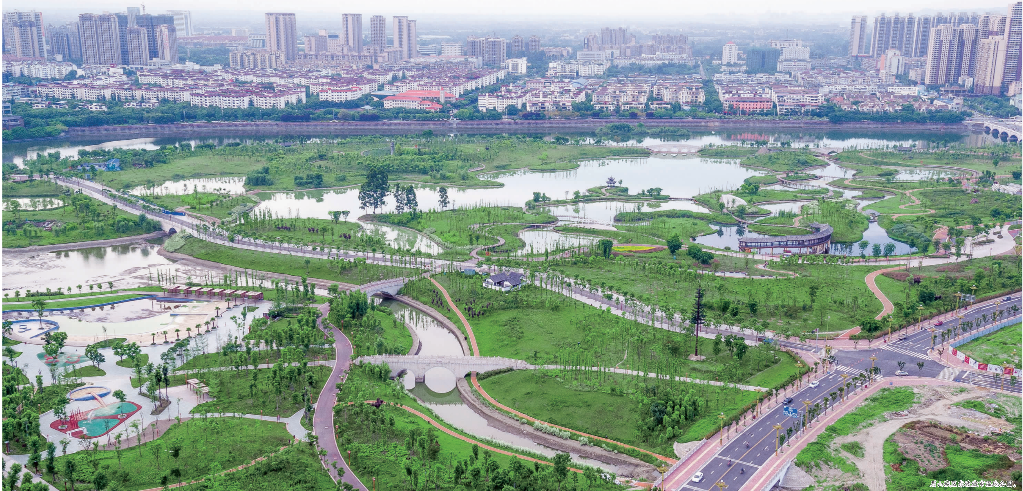
眉山城区东坡竹园湿地公园。

“真山真水的自然景观是公园的特色。”仁寿县建设局相关负责人介绍,公园占地面积约2000亩,水域面积占780亩,拥有高滩花谷、在水一方、青莎亲岸、临峰水湾、曾子映月、水舞频频、幻影彩堤地、绿紫水坝、云观翠峰、山林园等十大景点。