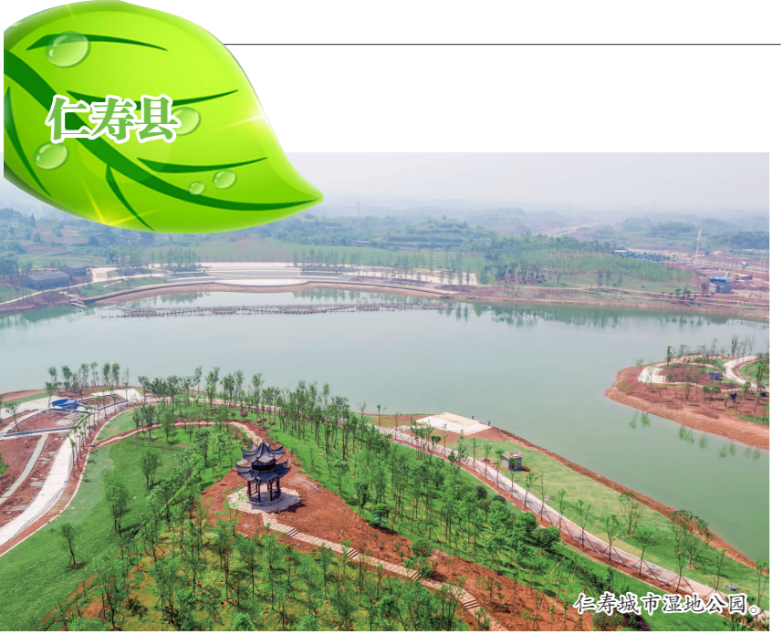
仁寿县湿地公园。

与此同时,彭山区委、区政府以“四引”“五水”工程为载体,建设生态文明城市,形成上下贯穿、水域连通、环保生态的自然水景观。通过引水入城、引水入