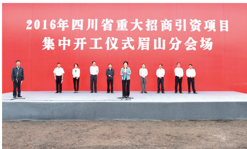
李静宣布2016年四川省重大招商引资眉山分会场项目集中开工。