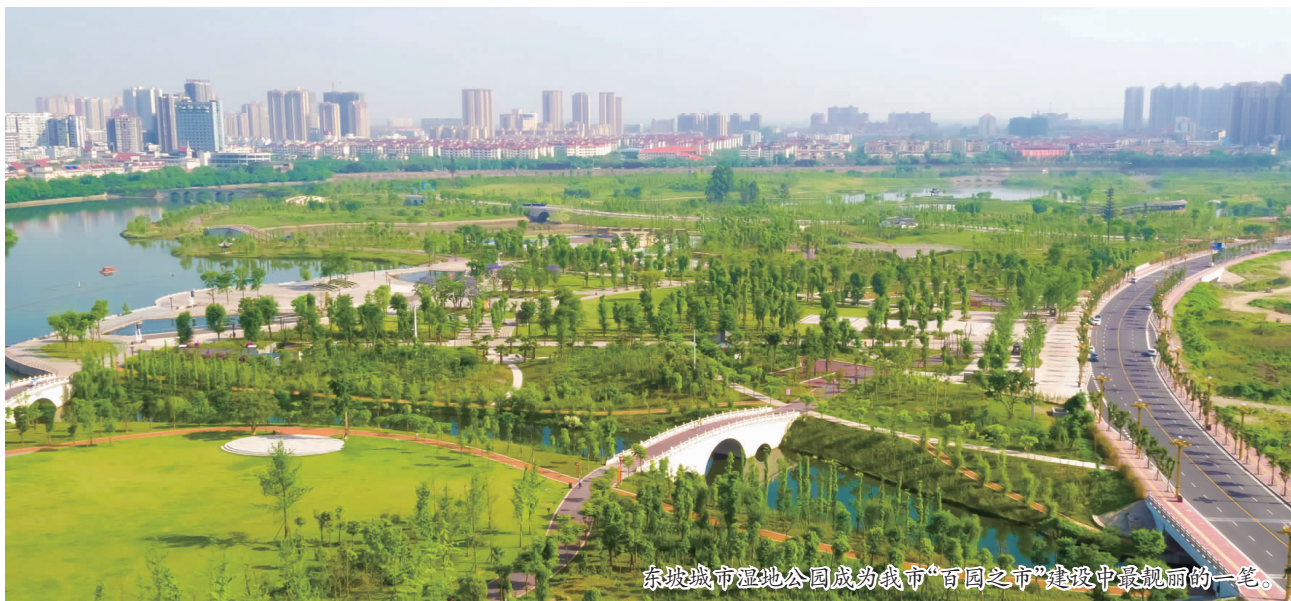
东坡城市湿地公园成为我市“百园之城”建设中最靓丽的一笔。

5月18日,记者在项目现场看到,青衣江水穿洪雅县城而过,引得上千市民驻足拍照留念。蓝天、白云下,江水与河岸步道、景观大树、休憩沙滩相映成趣,构成一幅如诗如画的山水盆景画卷。