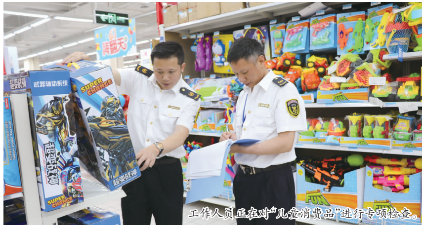
工作人员正在对“儿童消费品”进行专项检查。

经过检查,我市市面上销售的3C认证类儿童消费品主要来自广东、上海、浙江、江苏等正规厂家,绝大部分为符合安全的产品。目前,仅洪雅发现一起销售无证产品的行为,已立案调查。