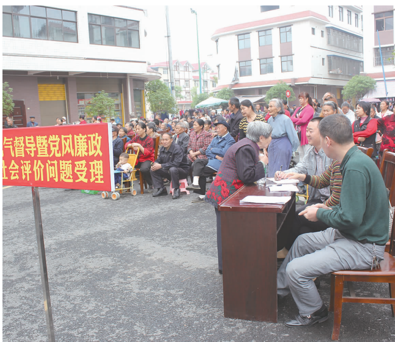
“换届风气督导组暨党风廉政建设社会评价问题受理点”被搬到了现场。

据悉，从2015年开始，青神县在全县89个村(社区)每月确定相对固定的1天作为党群集中活动日，旨在通过政策宣讲、开展便民服务、技术培训、文体活动等，更好地发挥村级党组织的核心引领作用，更好地凝聚党心民心，更好地提高群众参与的积极性和主动性，赢得群众的欢迎和拥护。目前，以“两学一做”为主题的党群集中活动日活动正在各村陆续展开。