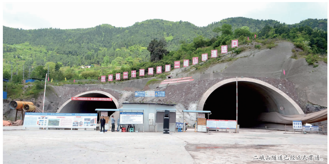
二峨山隧道已经正式贯通。

二峨山隧道是成都经济区环线高速公路仁寿段的主要控制性工程,隧道全长4536米,其中左洞2254米,右洞2282米。该隧道位于龙泉山脉,地质条件复杂,属于低瓦斯隧道,施工时易出现浅埋、偏压、顺层、瓦斯不良等地质情况。针对地质难题,施工单位先对进洞方案进行了优化,在确保安全、完成临时边坡防护等辅助施工后,4个洞口同时开工,历时500多个日夜,完成了工程开挖任务,预计5月中旬将全部完成初支仰拱和衬砌工作,比工期要求提前45天。据悉,这也