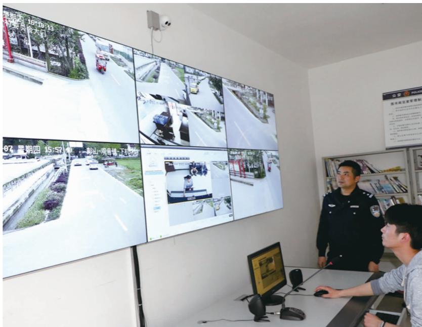
观音派出所所监控指挥平台工作人员实时操作监控现场。

“在每个村安装监控平台,其目的是通过构建信息化防控体系,实现视频监控入户联网、采集调度、回放、一键报警等功能,有效遏制犯罪,确保区域内的百姓平安,社会和谐。”该区相关负责人表示,建设4级网络监控平台,是实实在在的一项民生工程,对于保护百姓安全,建设和谐社会,有极大的推动作用。