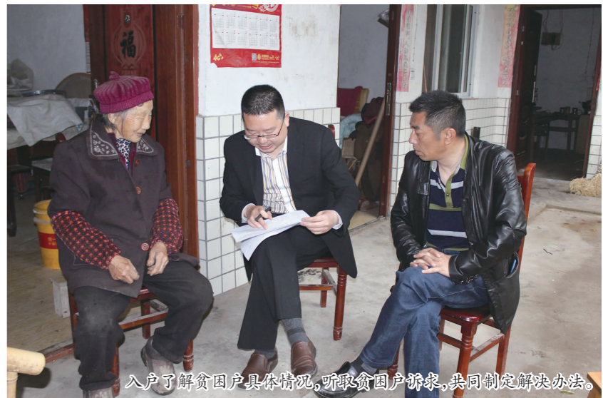
入户了解贫困户具体情况,听取贫困户诉求,共同制定解决办法。

本报讯(刘依琳 记者 王允浩 文/图)近日,按照统一部署,东坡区人社局党组成员深入所联系贫困村和帮扶户,按照“六个精准”要求,推动“五个一批”精准脱贫措施的落实,为联系村和贫困户办实事、解难事,以实际行动