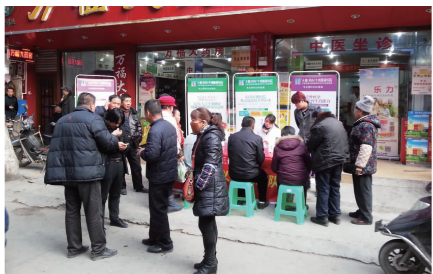
为了增强眉山百姓的健康意识,按照上级部门的安排,日前,眉山正德医院在彭山区青龙镇开展公益下乡义诊活动。此次爱心义诊免费为群众进行健康服务,让群众树立无病早预防,有病早治疗的意识。同时,也切实解决群众对于春季容易滋生细菌的困扰,受到了群众的欢迎和赞赏。

收购价每斤几元钱,德国从银杏叶里研发出降血压降脂的新药,这些药物市场价格高达数百元。 “传统中药养生讲究原料的道地性,‘道地药材’是高质量产品的第一保证。”游洪涛说,应建立完善的中药质量标准体系,例如对中药材种植各个环节,如每亩地的种植密度以及水、农药、肥料的使用等方面做出详细规定,但不能照搬西药的标准,要在中药药效的基础上建立质量标准。同时,还要完善相关法律法规,相关部门应对使用违禁农药等违规行为进行严厉处罚。 去年,国家相关部委已启动中医药服务贸易重点项目,探索中医药服务贸易发展模式。业内人士表示,国家应出台具体政策鼓励药企加大研发投入,增强专利意识,提升产品科技含量,例如对实现创新突破、获得核心专利的企业加大奖励力度等。