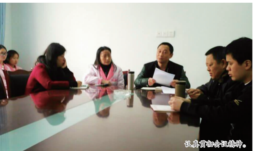
认真贯彻落实会议精神。