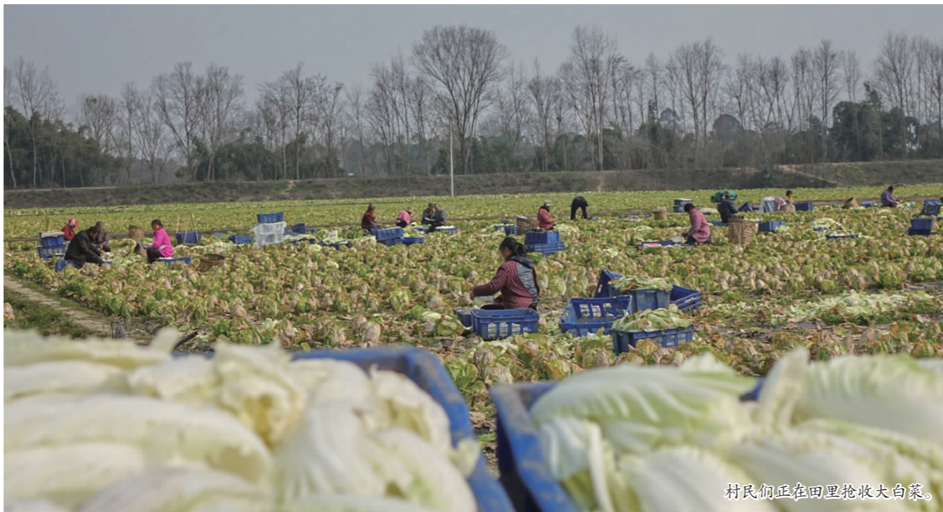
村民们正在田里采收大白菜。

据了解,近年来,青岗坪村不断加大土地流转力度,全村约3000亩耕地中有近1000亩已流转给农业业主,既推动了农业规模化产业化,又为村民就近就业增收创造了条件。