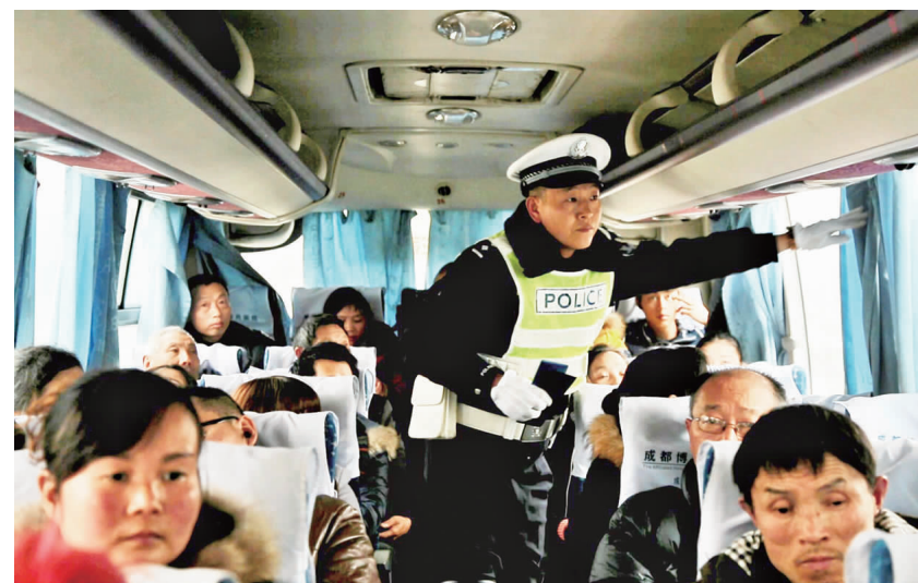
春节临近，市公安局交通警察支队直属一大队民警正在对辖区区内客车进行例行检查，严查超员、超速等严重违法行为，并对车载安全设施进行逐一检查，保证春运期间人民群众生命财产安全。