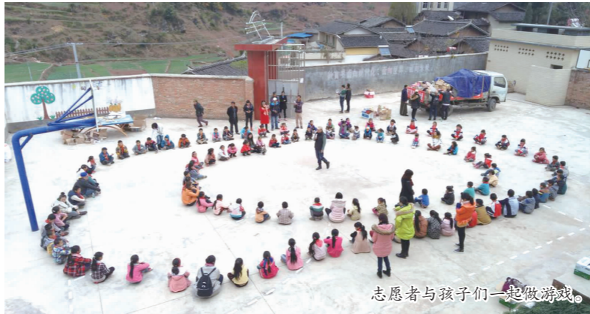
志愿者与孩子们一起做游戏。

据悉,此次活动得到了彭山区许多爱心人士的帮助,他们纷纷捐赠了生活用品、学习用品、常用药品等。虽然很多人因为没能亲自前往而感到遗憾,但也纷纷表示了希望今后能参与更多爱心活动的愿望。