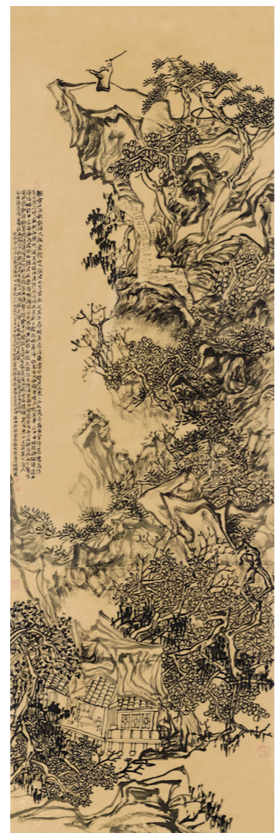
黄耀聪《东坡放鹤亭》 国画