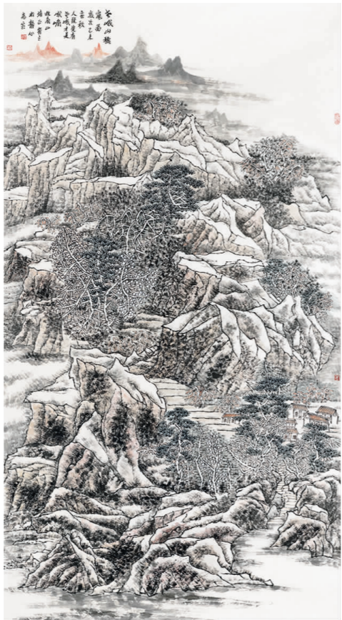
万培正《老峨山秋》 国画