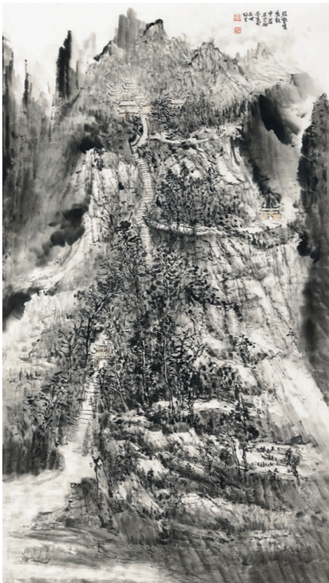
朱福昌《隽秀数中岩》 国画