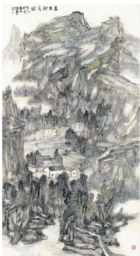
庄朝华《象耳秋岚》 国画