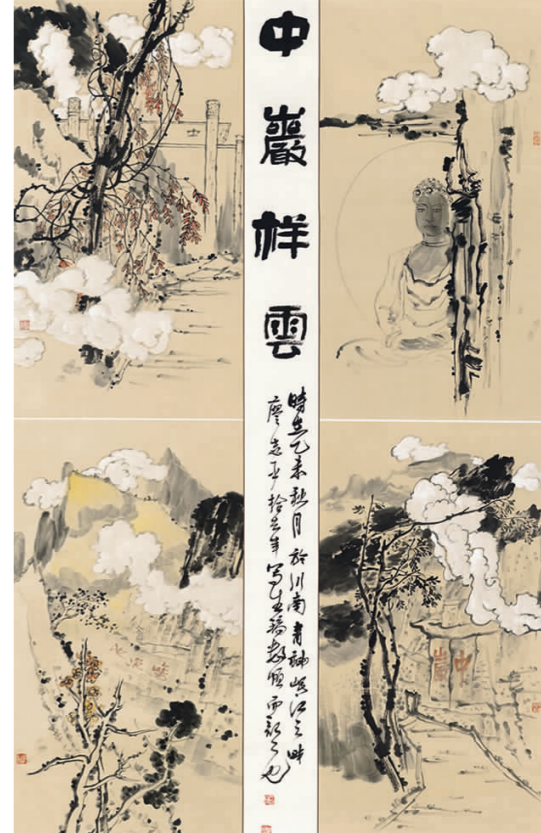
廖志平《中岩祥云》 国画