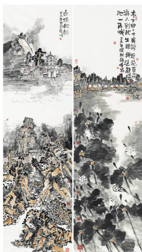
张峰《白塔秋韵》 国画