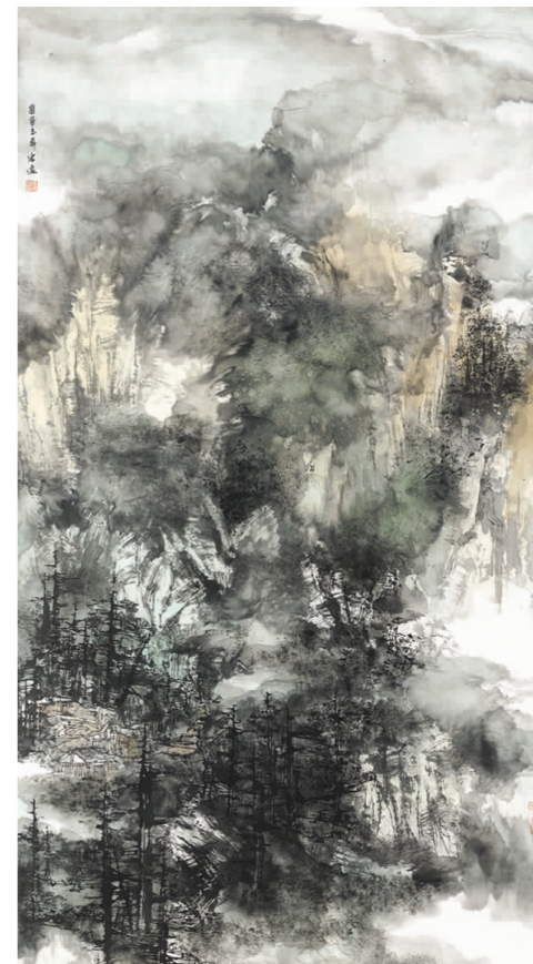
王宏远《翡翠玉屏》 国画