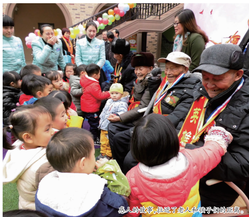
感人的故事，拉近了老人和孩子们的距离。

本报讯(通讯员 刘树军 文/图)昨(23)日，彭山区云堡幼儿园内，台上正在讲述着感人故事，台下师生和家长听得十分感慨。