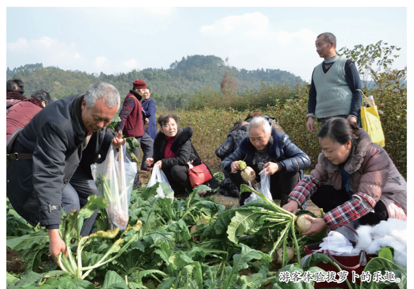
游客体验拔萝卜的乐趣。

本报讯(记者 张玉 文/图)12月22日，第四届四川·洪雅·三宝山金沙坝萝卜文化节热闹开场，来自四面八方的游客共同品鉴了美味佳肴，并对洪雅的绿色生态食品赞不绝口。