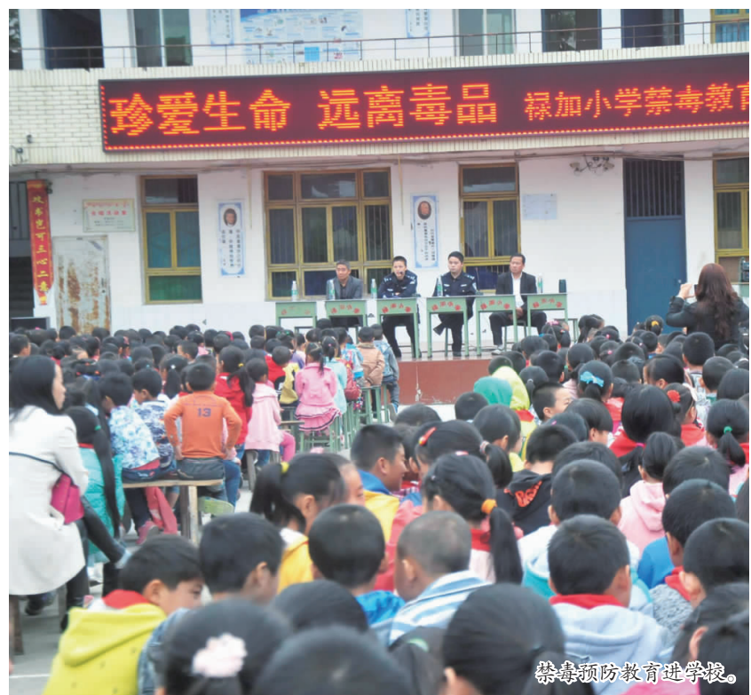
禁毒预防教育进学校。

生活中应该怎样预防毒品的侵蚀，以及公安机关对毒品的打击力度等多个方面进行了详细讲解。 “我们感触很深，受益匪浅。”全校师生纷纷表示，通过此次禁毒预防教育课，提高了自身的识毒、防毒、拒毒的意识和能力。