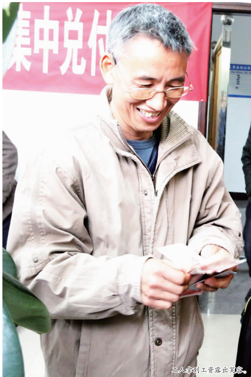
工人拿到工资露出笑容。