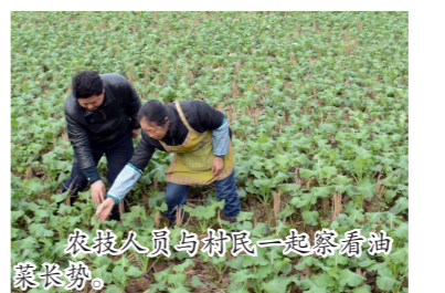
农技人员与村民一起察看油菜长势。

在仔细查看了油菜苗之后,农技人员发现,叶片呈现紫红色,而且细一看,没有新根,确实出现了僵苗。经过仔细询问得知,由于前段时间连续的阴雨天气,导致田间湿度过大,原本开好的排水沟,有的已经垮塌,沟内堵塞,所以有的油菜苗整株都被水浸泡着。