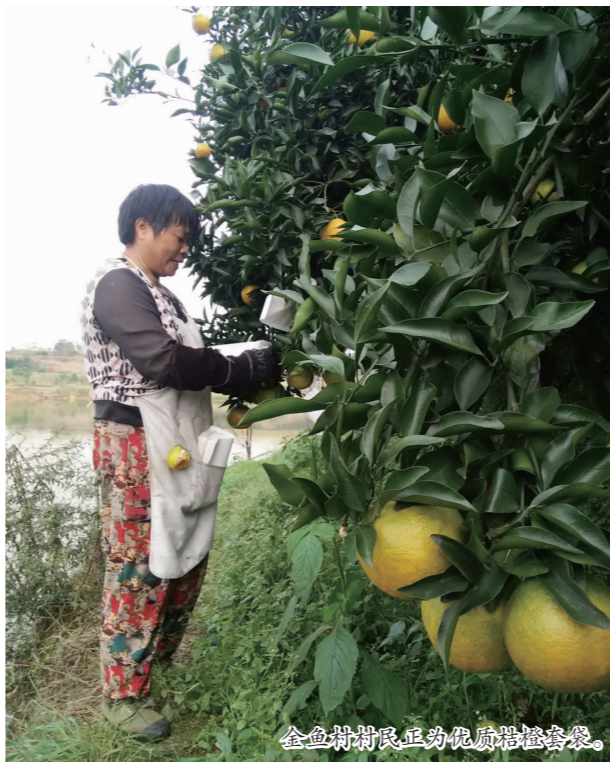
金鱼村村民正动优质脐橙套袋。