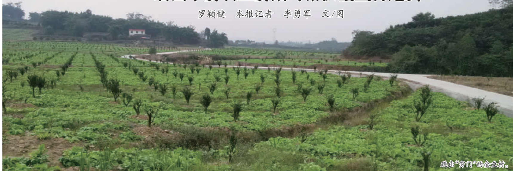
跳出“穷门”的金鱼村。

彭山区黄丰镇金鱼村位于两市之间,三县交界,地理位置偏远,全村4.8平方公里,耕地面积1665亩,共有4个村民小组475户1544人。受交通、水利、产业等因素制约,经济发展慢,贫困人口多,是出了名的贫困村,截至2011年年底,全村人均纯收入仅为5371元。