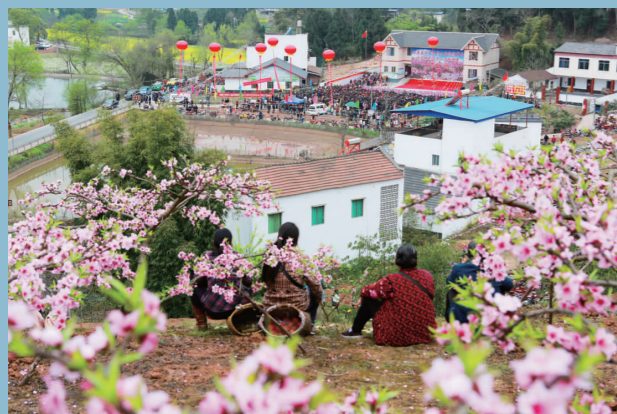
会节经济蓬勃发展。