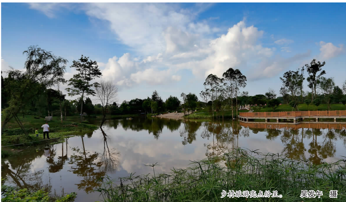
乡村游亮点纷呈。

“‘十三五’期间，我们将重点做好三个方面的工作：一是优化旅游发展环境，提升和完善城市、景区旅游功能；二是深度开发休闲度假旅游产品，特色旅游商品和旅游节会；三是突破传统乡村旅游发展模式打造旅游新业态项目，建立网络营销和信息发布体系。”仁寿县旅游局相关负责人说，“目的只有一个，就是立足优势、整合资源，圆满完成‘十三五’的各项目标任务。”