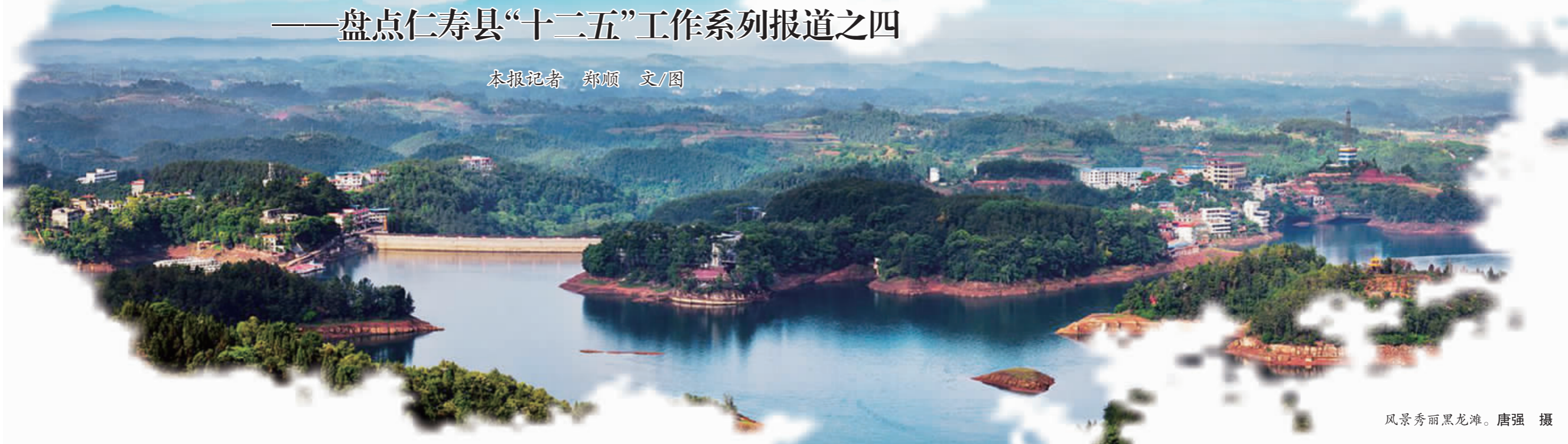
风景秀丽黑龙滩。