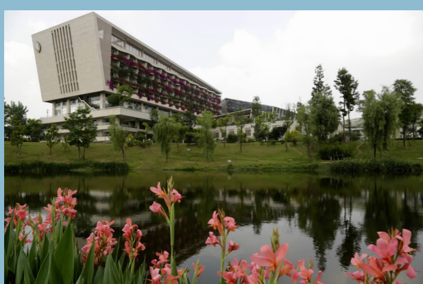
休闲度假方兴未艾。

“十二五”期间，仁寿县按照市委、市政府创新“四种模式”、加快“四个转变”的总体部署，积极抢抓国家级天府新区、成都新机场规划建设和省委、省政府支持百万人口大县改革发展等重大机遇，充分利用全省乡村旅游示范县、全省旅游标准化示范县等品牌，强力推进“以游为主、统筹城乡”。旅游优势资源得到进一步开发、基础设施不断完善、重大项目有序推进、服务质量稳步提升……全县旅游事业呈现蓬勃发展的良好态势。