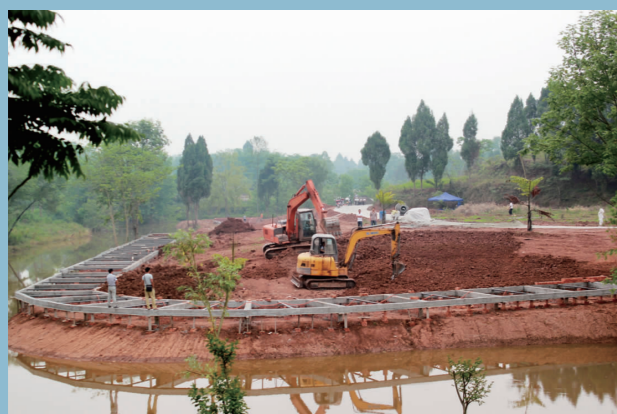
正在打造中的乡村旅游项目。