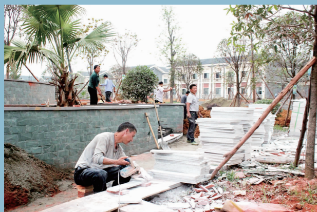
加快旅游基础设施建设。

■转变人数：预计到2015年年底，仁寿县农民转变为三产经营者或从业者7694人，完成市上7182人目标的107.1%。