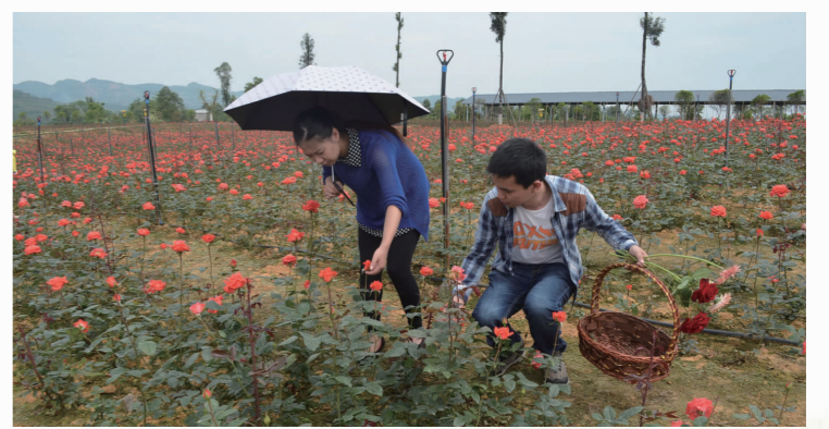
天府花海示范基地,兴业富民已见成效。

加强产业化经营项目的实施。预计到2015年末,全县土地流转面积将达35万亩以上,完成45个乡镇农村土地承包经营权确权登记颁证工作。深化“两个带动”,积极培育新型农业经营主体,创建市级以上农业产业化重点龙头企业23家以上,发展农民专合组织686个,家庭农场100家以上;累计培育现代农业业主2067户,转移农民6800人以上。加大农业品牌创建,创建中国特产之乡3个、国家地理标志登记保护产品3个、有机食品5个、有机转换食品12个、绿色食品13个、无公害农产品24个,仁寿农产品知名度和市场占有率不断提高。