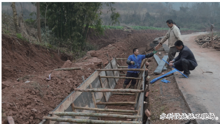
水利设施施工现场。

“十二五”期间,仁寿县承担了种植业涉及惠农补贴、高产创建、基础设施建设、农作物病虫害防治、农业服务体系、科技培训、农村能源建设、农产品质量安全、新技术推广、农业产业基地建设等方面的重点建设项目78个,总投资77436.4万元,其中国家投入77236.5万元。这些项目的实施和完成对改善全县农业基础条件,提高农业综合生产能力和农业比较效益,增加农民收入起到了积极的推动作用。